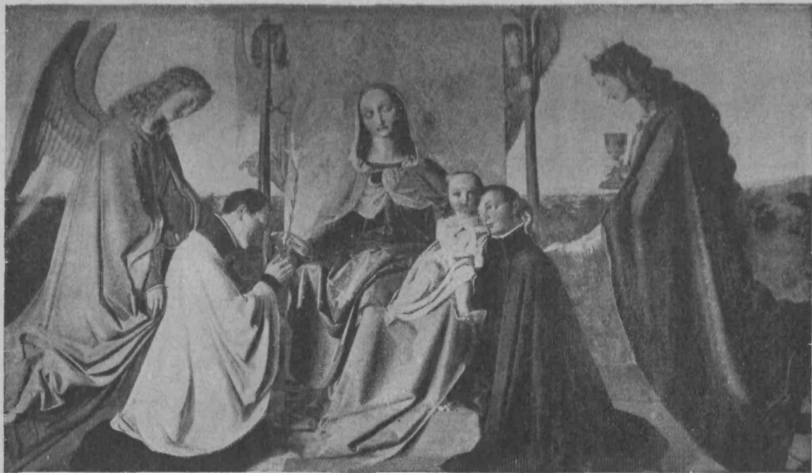
Sv. Alojzij in Stanislav, goreča častilca Matere božje.