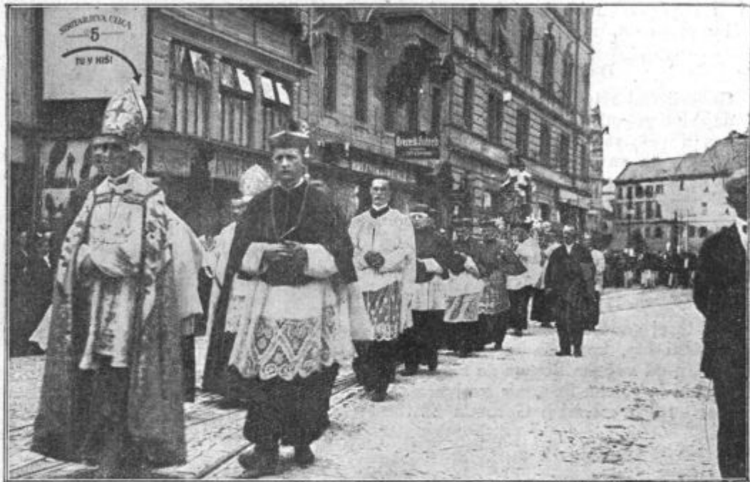
Procesija Marijanskega kongresa.

Molimo! Daj mi, o Bog, tako iskreno in odkritosrčno ljubezen do bliž-njega, kakor jo je dal toliko svojim svet-nikom, ki skoraj nikoli niso videli bliž-njega, ne da bi mu želeli zveličanje, ne da bi natihem zanj molili in ga priporočili njegovemu angelu varuhu!