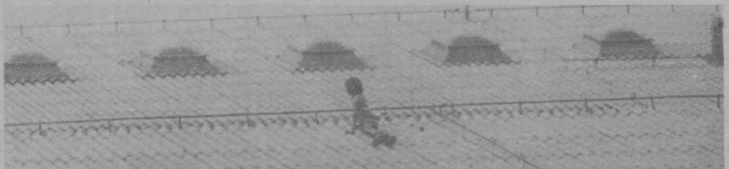
Zviška še više