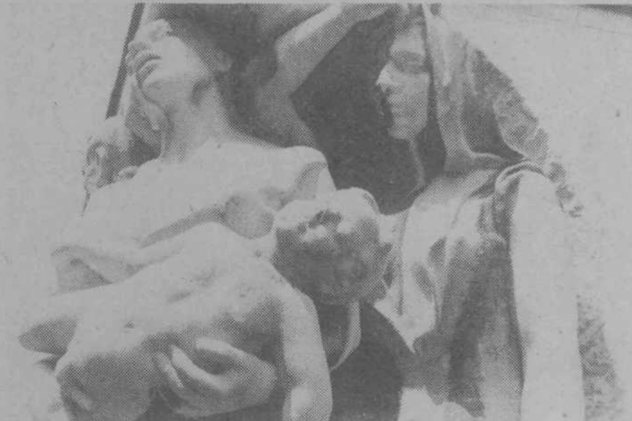
Detajl s spomenika na Urhu