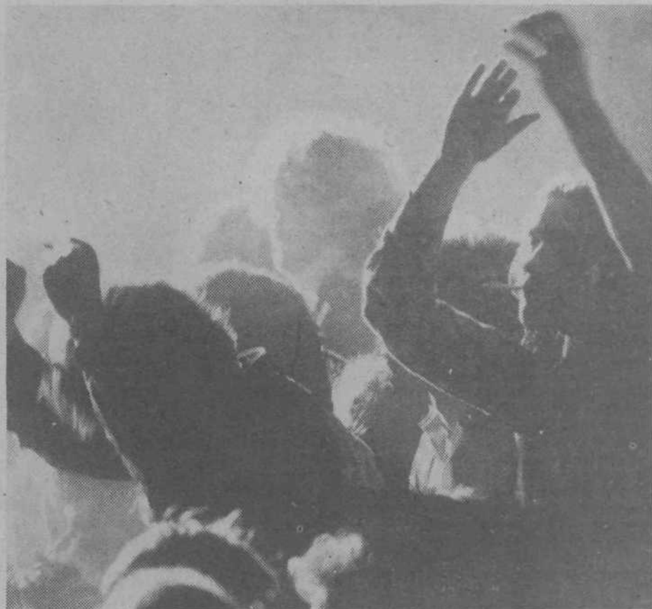
Ritem In zvok