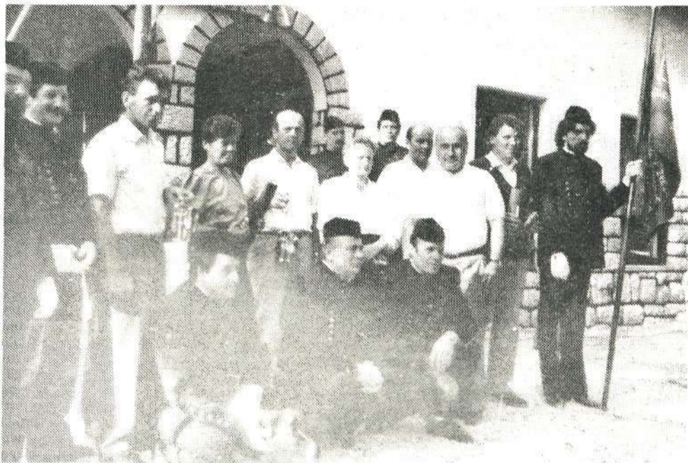
Jubilanti in upokojeni rudarji: ostaja spomin na dolgoletno delo