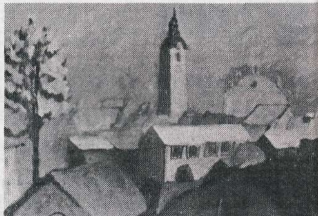
»Iz okolice Kamnika« tempera, 1989