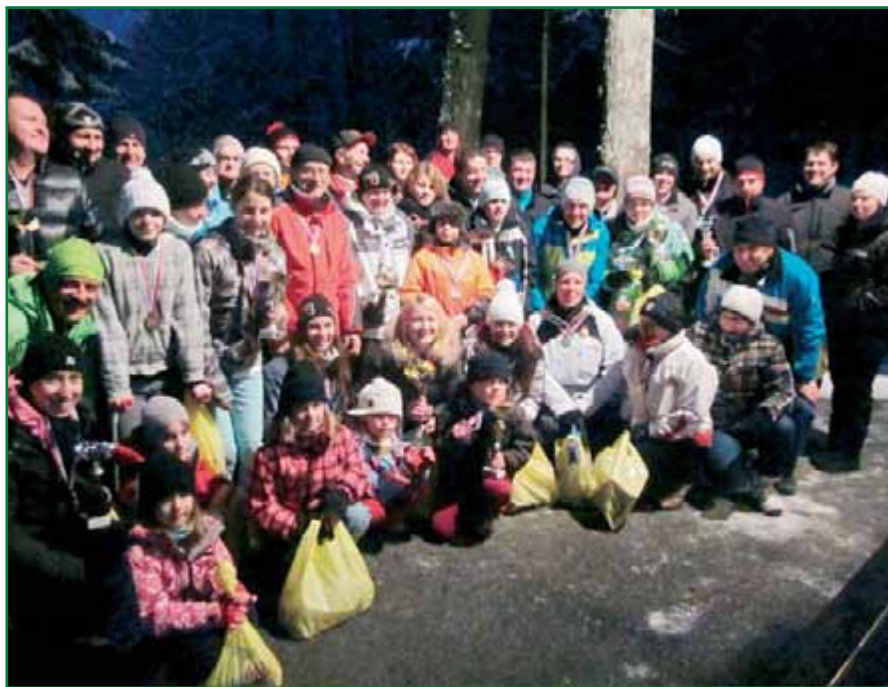
Ob zaključku letošnjega memoriala.