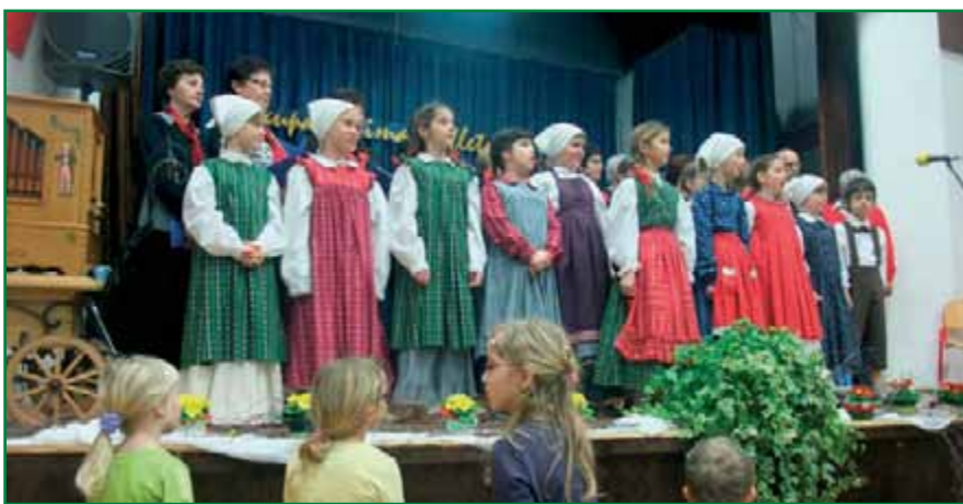
Če bi vedno bile generacije takole usklajene.