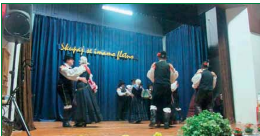
Folklorna skupina DU Komenda