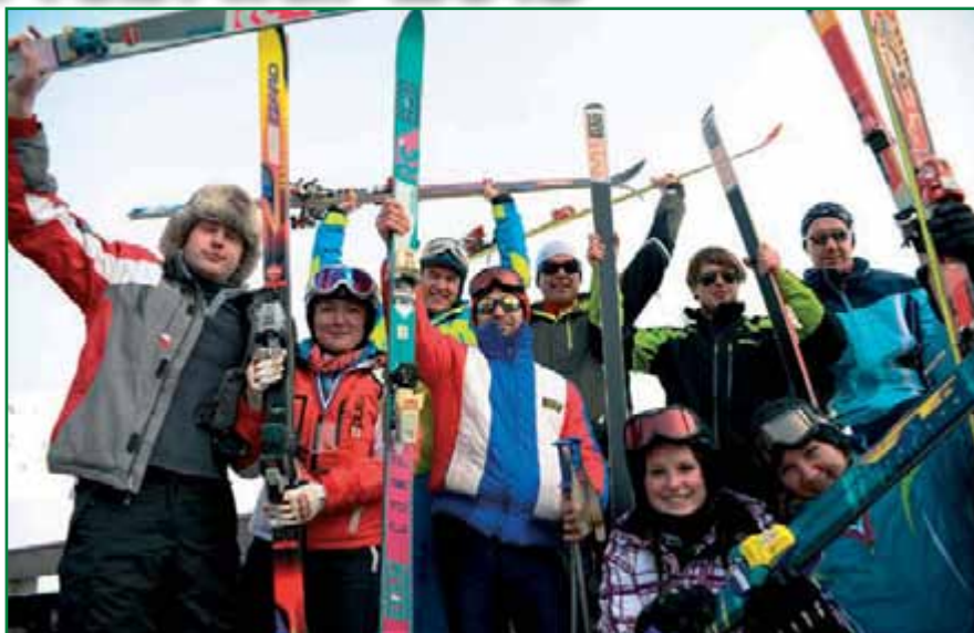
Lep pozdrav od 'retro smučarjev!'

Na letošnji tekmi smo imeli prijavljenih 76 tekmovalcev, na koncu pa se je iz startne hišice po progi pognalo 71 ljubiteljev smučanja. Letos nam jo je zagodla tehnika, ker nam ni delovala ura za merjenje časa. Počakali smo 45 minut in tekma se je lahko začela. Žal pa smo, mogoče zaradi tehničnih težav, pri razvrščanju tekmovalcev po kategorijah naredili napako in pri dveh kategorijah napačno razdelili medalje. Napako smo ugotovili šele zvečer, ko smo še enkrat pregledovali kategorije. Ker je edino pravilno, da zmotno popravimo, smo naslednji dan vsem, ki se jim je zgodila krivica, poslali pravilne rezultate ter prošnjo, kako naj si med seboj izmenjajo medalje. Še