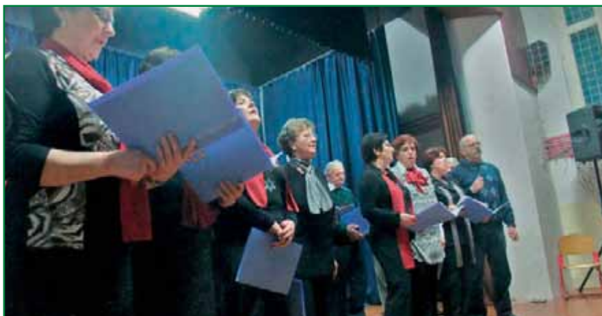
Domači pevski zbor