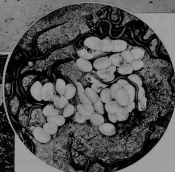
Mlade belouške, ki so pravkar zlezle iz jajc.

Spodaj: Kačje strupe uporabljajo, kakor znano, tudi v zdravilne svrhe. V to svrhu kače goje ter jim potem umeinim potom odvzemajo strup. Slika nam kaže ta nevaren posel v nekem ameriškem zoološkem vrtu.