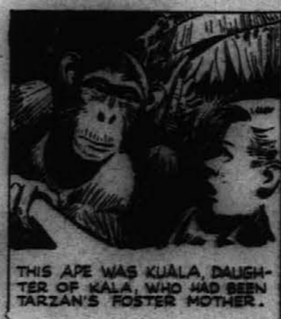
Ta opica je bila Kuala, hči opice Kala, ki je bila Tarzanova hranilna mati. Sedaj ima tudi ona, kakor njena mati, malega človeka, ki ji nadomesti sina.