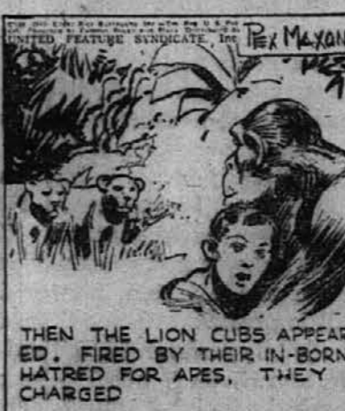
THEN THE LION CUBS APPEARED. FIRED BY THEIR IN-BORN HATRED FOR APES, THEY CHARGED