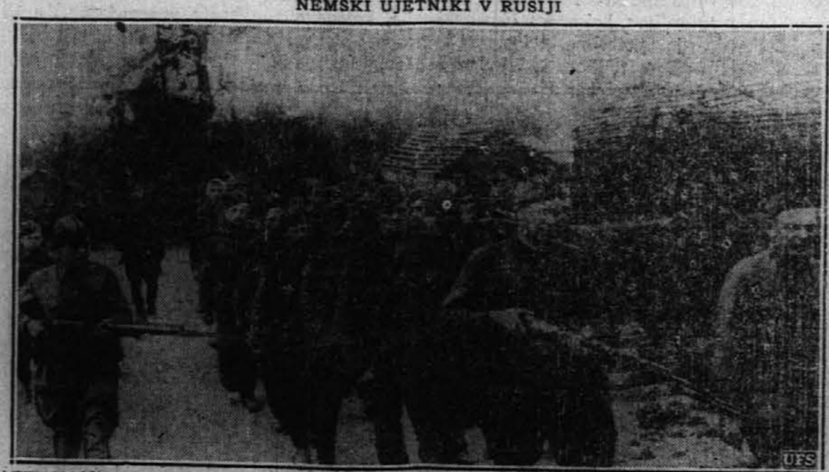
Kakor trdijo sovjetski krogi, so znašale nemške izgube, predno se je začela sedanja velika ofenziva, do tri milijone mož, padlih, ranjenih in ujetih. Gornja slika kaže skupino teh ujetnikov, ko jih ruski stražniki z nabitiimi puškami vodijo v ujetniško taborišče.