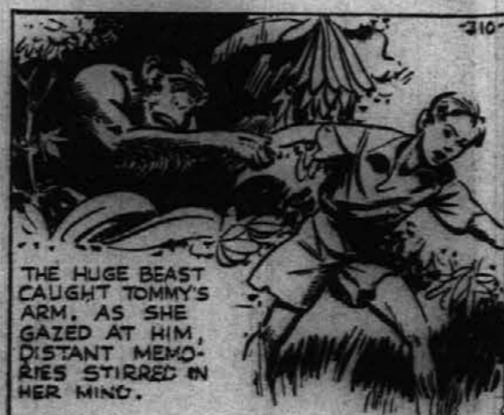
Velika opica je kmalu pograbila Tommyja za roko. Ko ga je pogledala so se ji vzbudili spomini.