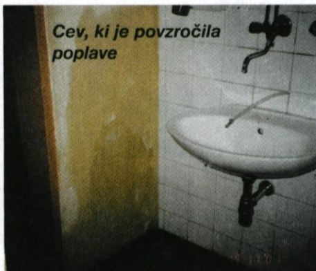
Cev, ki je povzročila poplave

Ob požrtvovalnem delu gasilcev, prostovoljcev in delavcev šole, nam je uspelo odstraniti vodo, dvigniti omare in prenesti ostalo opremo na suho.