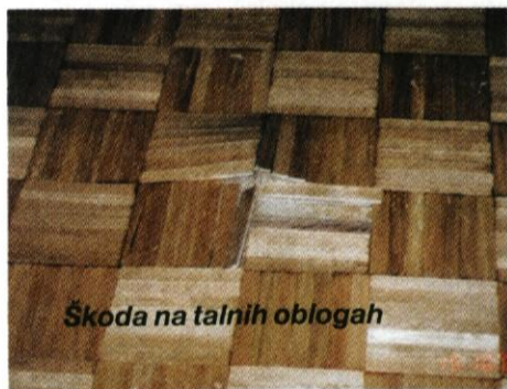
Škoda na talnih oblogah

V ponedeljek, 15. oktobra, smo v drugem nadstropju namestili 22 kondenzatorjev, ki so 2