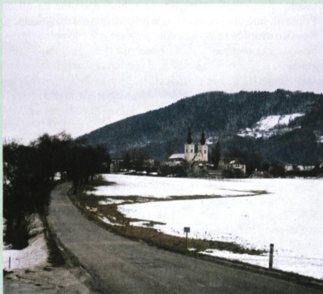
Pogled proti Moravčam, kjer se zrcali drevored

V drugem scenariju ima glavno vlogo DENAR. Prostor se gleda in vrednoti le skozi prizmo možnega gradbišča. Ne glede na dane kvalitete prostora in na obstoječ način pozidave prostora, se na podlagi dogovorov občinske uprave in lastnikov parcel, ki bodo lastniki le toliko časa, da zemljišče, ki so ga kupili kot kmetijsko, prodajo kot stavbno, predvidi pozidava, ki v večini primerov ne upošteva pravil prvega scenarija: gozdovi se izsekajo, vodotoki se regulirajo, močvirja se nasujejo in na vsako parcelo se postavi kar največ kvadratnih metrov uporabne površine.