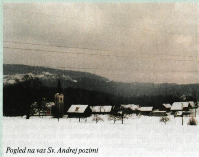
Pogled na vas Sv. Andrej pozimi

Prvi poteka skladno s predpisi za urejanje prostora. Po tem scenariju je nemogoče najti novogradnje ob cesti iz Moravč proti Zagorju, raztresene kot bi jih nekdo izgubljal iz raztrganega žepa. V tej zgodbi imajo najpomembnejšo vlogo pooblaščenči načrtovalci, ki skladno s svojim strokovnim in etičnim načelom, ter skladno vrednotam prostora, naredijo načrte za pozidavo na tak način, kot so to znali naši predhodniki: iz ravninskih polj pozidavo umaknejo pod vznožja hribov, območja gradnje strnejo v organizirana naselja, velike in moteče objekte umaknejo iz območij, kjer prostoru vladajo prostorske dominante (gradovi, cerkve, naravne vzpetine..) Po tem scenariju lastniki zemljišč spoštujejo naravo, vedo, da gradnja blizu vodotokov lahko povzroči nevšečnosti, poznajo vrednoto kmetijskega zemljišča, ki ni prekinjeno s prometno cesto in se z ureditvami načrtovalcev strinjajo. Občinski svetniki brez pomisleka glasujejo za sprejem takšnih urbanističnih rešitev, saj so gradbena dovoljenja izdana le za gradnjo, skladno obstoječim vrednotam prostora.