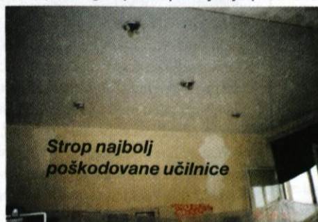
Strop najbolj poškodovane učilnice

22. oktobra se je na izredni seji sestel Svet šole, ki je ustanovil komisijo za spremljanje sanacije.