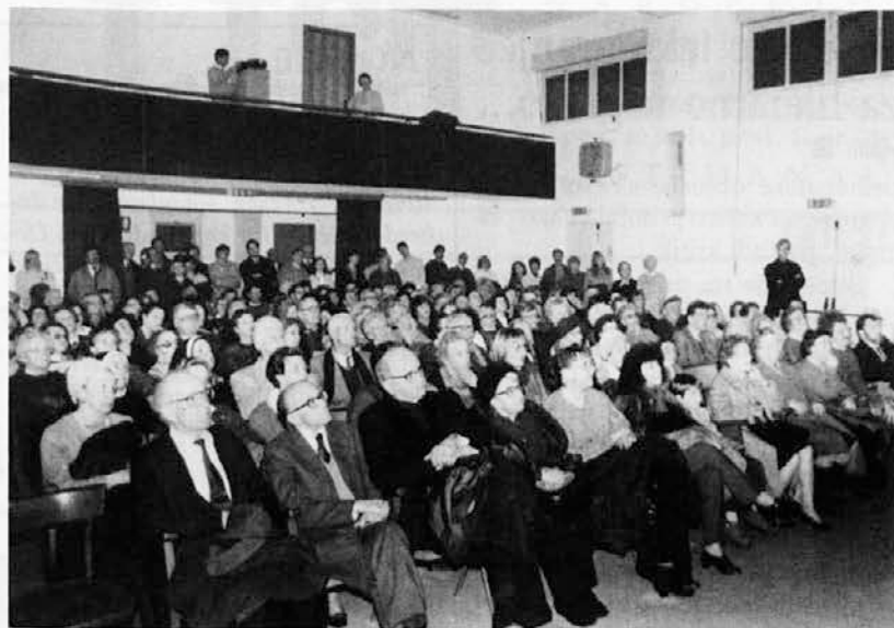
Prireditve v svetoivanskem Marijinem domu so običajno dobro obiskane...

Zaradi novih protipožarnih norm je bil svetoivanski Marijin dom dve leti zaprt (od 1987 do