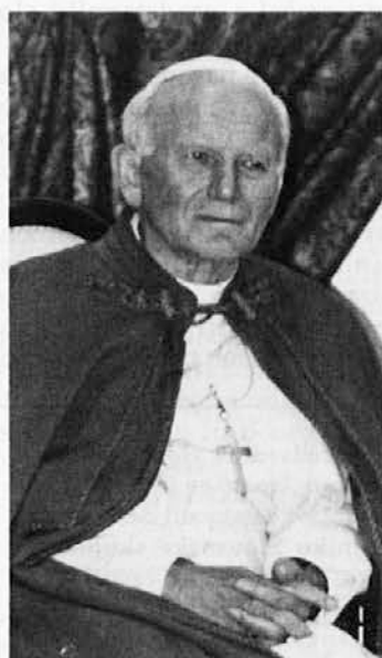
Katoliški svet je v skrbeh za zdravje papeža Janeza Pavla II., ki je od nedelje, 12. t.m., v rimski kliniki Agostino Gemelli. Potreben je bil kirurški poseg, ki je, kot kaže, uspel. V tej bolnišnici se je Janez Pavel II. zdravil po atentatu pred 11 leti.