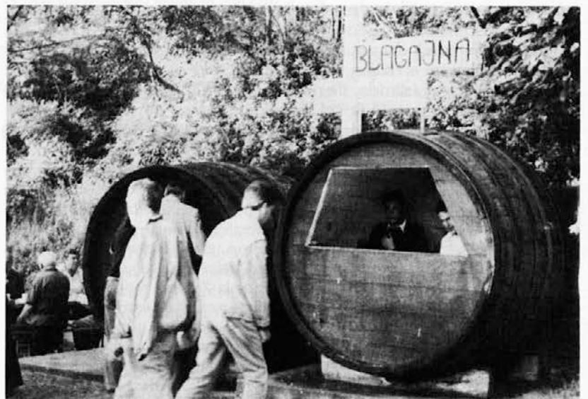
V ponedeljek, 13. t.m., se je v Ricmanjih zaključila 20. zabavna prireditelja, ki jo prireja domače društvo Slavec vsako letu ob zaključku sezone. Prireditelji so letos poskrbeli za res prijeten in zanimiv kulturni spored. Na sliki: izvorna in domiselna blagajna, ki so jo izdelali domačini