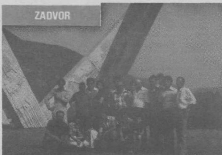
Pred spomenikom padlim borcem v Drvaru