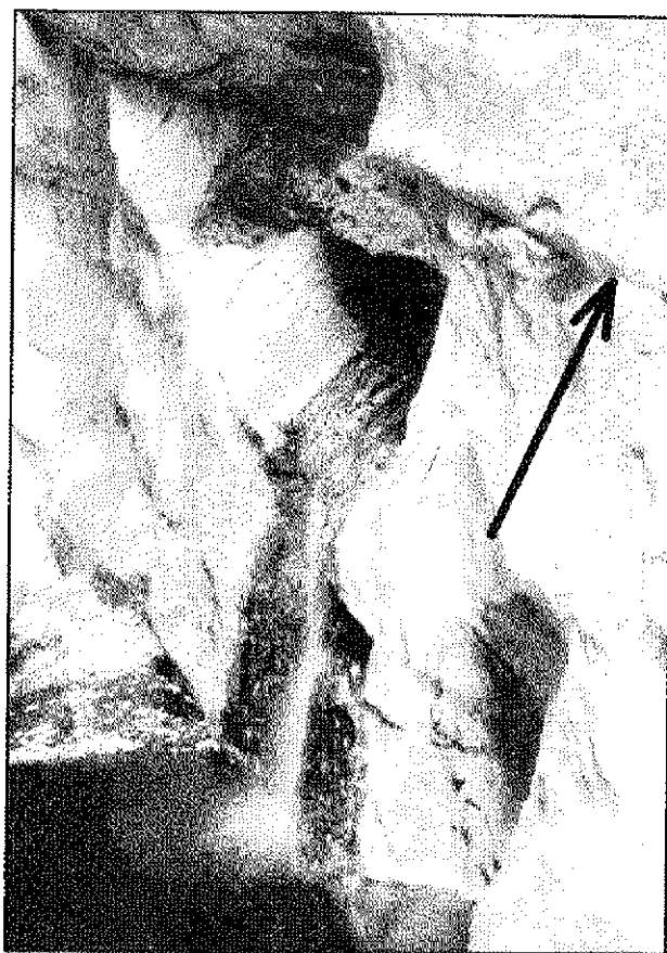
Slika 2: Nosilna lezika 600.

Odnešena gmota kamnine med boki je bila pred udorom verjetno prevotljena kot mravljišče. Videti je, da je bil pretok vode še v obdobju laminarnega toka bolj ali manj neoviran po večji površini lezike (slika 4).