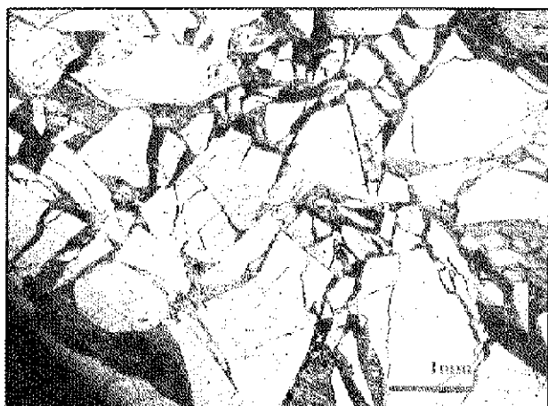
Slika 3: Zelo zdrobljena kamnina ob nosilnih lezikah. Fig. 3: Extremely tectonically crushed rock along formative bedding-planes.

Kratko lahko odgovorimo na osnovni vprašanji: