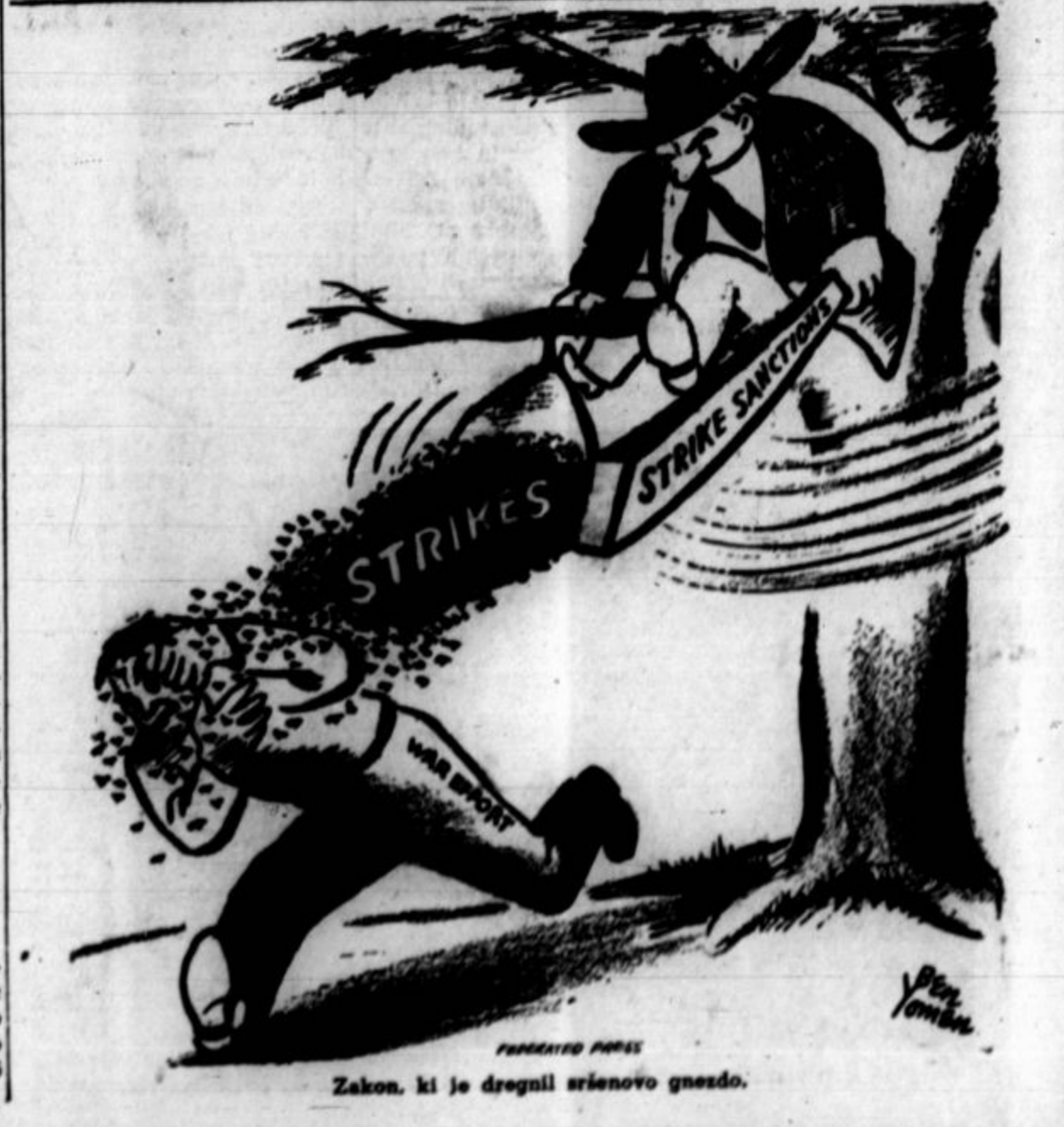
Zakon, ki je dregnil srienovo gnezdo.

Poučeni washingtonski krogi pravijo, da si Amerika prizadeva, da ona, ne Rusija, izvede glavni udarec Nemčiji, Stalin pa misli drugače. Iz razumljivih razlogov on želi, da bi to delo opravila Rusija, ki je največ pretrpela v tej vojni ter največ doprinesla k zmagi v krvi in materialni škodi. Vprašanje je, kako dolgo bosta Roosevelti in Churchill mogla vztrajati v svoji politiki, ne da bi pristala na moskovske pogoje.