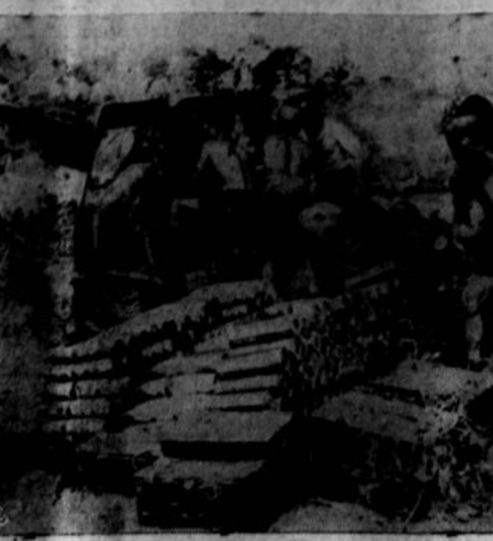
COVERING AN INFANTRY ADVANCE, a Canadian gun crew works in shorts as they lay down a heavy barrage on Nazi positions near Nissoria, Sicily. These men and other Allied gunners hurled 16,000 shells in two hours on a square mile area.

le tu pa tam iz kakega daljnega mesta. Irma je ostala pri očetu sama, izkusila pomanjkanje in slednjič je ušla. Dobila je službo in si najela sobo.