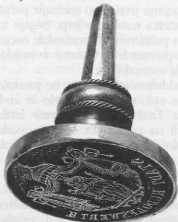
Pečatnik Novega mesta, 1865.

Marija Terezija se Novega mesta ni dotaknila le z ustanovitvijo gimnazije, pač pa posredno tudi s korenitimi upravnimi reformami, ki so mestu odvzele dobršen del avtonomije. Od 1748 do 1849 je bilo Novo mesto sedež okrožja. Kresijska uprava je v prvi polovici 19. stoletja za svoje sprejela uradno ime Neustädt, zanimiva pa je, da se odtis tega pečatnika pojavi tudi še v letu 1851, čeprav je bilo okrožje ukinjeno že leta 1849. 11