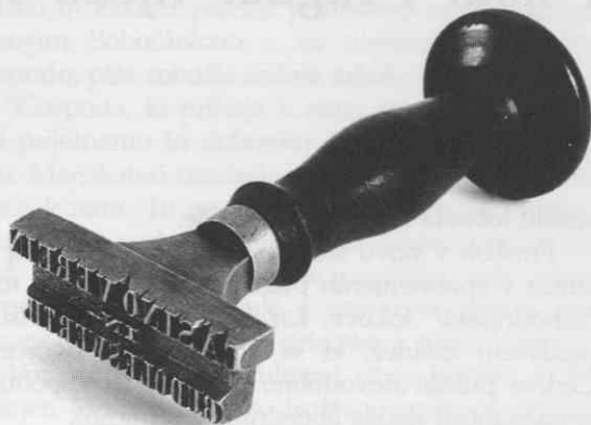
Pečatnik kazinskega društva v Novem mestu, 19. stoletje.

buti (s košaro na hrbtu, lonci in bisago, ker je zbiral hrano za bolnike), pa tudi z granatnim jabolkom. Granatno jabolko ima več pomenov, v krščanski mistiki pa simbolizira samo Cerkev, najvišje božje skrivnosti in božjo popolnost. 35