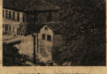
KEMIČNA TOVARNA V HRASTNIKU bo letos povečala vrednost proizvodnje za 150 milijonov dinarjev