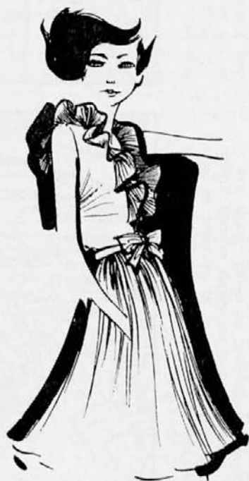
Za tiste, ki imajo ozke boke: bluza iz šifona zelene barve ter krilo, prav tako iz šifona, toda v kontrastni barvi, živo modri ali rožnati