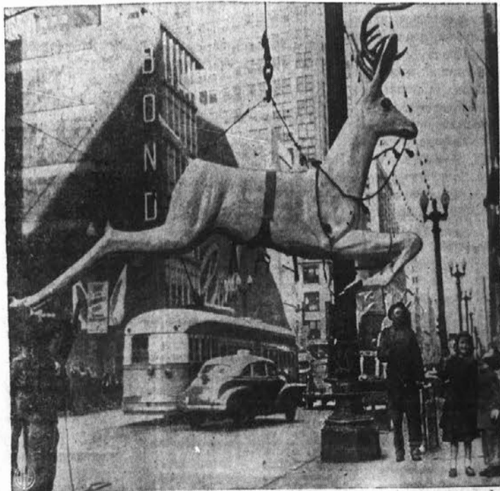
Poglejti, poglejte, kdo je tukaj. — Na prometni State Street v Chicagu so že pričeli oglašati nakupovanje božičnih daril. Otroci z veseljem opazujejo delavce, ki dvigajo lepega jelena na vrh občestne svetilke in kako bi se ga ne veselili, saj fim je prednaznanilo, da se bliža Miklavž.

ki je odšel v večnost dne 29. nov. 1949. Dragi soprog in ljubljani oče, na Tvoj grob danes spominj hite, večni Bog Ti deli plačilo, spavaj v grobu zdaj sladko. Zalujoči ostali: SOFROGA in OTROCI Cleveland, O. 29. nov. 1949.