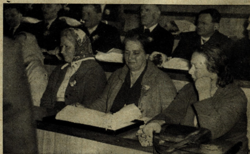
Že med poslovilnimi govori so se marsikomu orosile oči.

Po končani slovesnosti so se upokojenci odpeljali v gostišče »Na gričku«, kjer jim je naš kolektiv priredil svečano kosilo. Ob kozarcu dobrega vina so se upo-