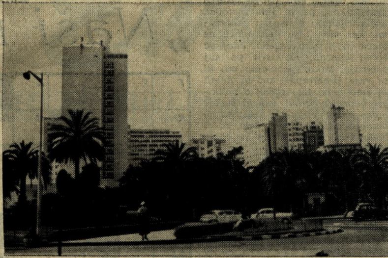
Moderna četrt Casablanke — gledana iz pristaniške smeri.

Danes še ne vemo, kako bo s finančnimi sredstvi, ki bodo odločilni faktor pri presoji in odločitvi za ali proti. Zato še ne moremo pisati o tem. Prepričani smo pa, da bodo organi delavskega samoupravljanja in uprava podjetja storili vse, da bodo našim delovnim ljudem letos omogočili prijetno letovanje na jadranski obali.