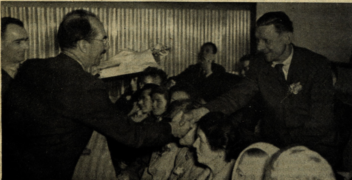
Predsednik DS in glavni direktor čestitata upokojencu.