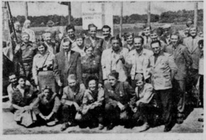
Ptujska partizanska patrola pred novim spomenikom