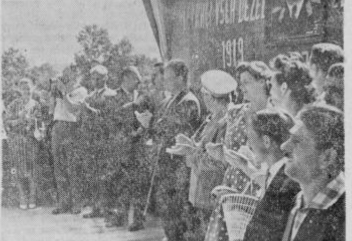
Gostje in predstavniki ter svojci borcev na tribuni