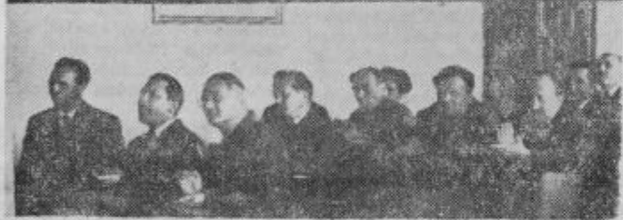
Gostje in odborniki občinskega ljudskega odbora na slavnosti seji