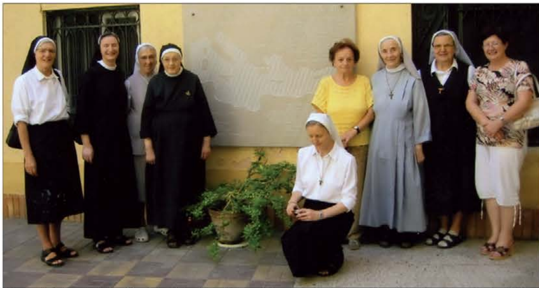
Ob zgodovinskem jubileju prihoda šolskih sester v Aleksandrijo so se udeležence svečanosti zbrale pod spominsko ploščo, na kateri je kipar Janez Lenassi začrtal pot Aleksandrink od Trsta do Aleksandrije.

sester. Pot po asfaltni puščavski cesti do "Al Iskandariyah -e" Aleksandrije je zahtevala potrpljenje, toda želja po ponovnem obisku mesta Aleksandra Velikega in radovednost, kako bo potekala svečanost v katedrali sv. Katarine, sta pregnali nestrpnost.