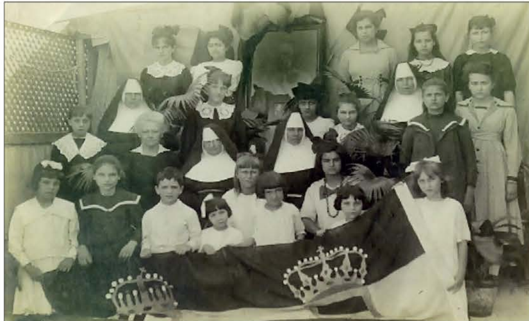
Zavetišče Francota Jožefa v Aleksandriji. Šolske sestre s slovenskimi otroki pred letom 1914.