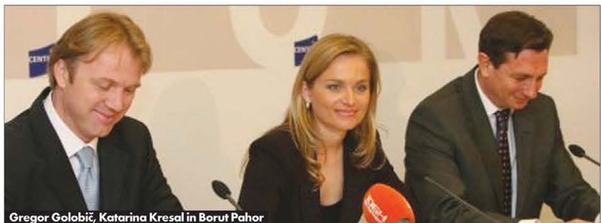
Gregor Golobič, Katarina Kresal in Borut Pahor

Med pomembne dogodke v Sloveniji v prejšnjih dneh sodi opomin Evropske komisije glede neprimernosti sedanjega sistema vinjet za uporabo avtomobilskih cest in hitrih cest v Sloveniji. Vinjete, ki veljajo šest mesecev oziroma eno leto, naj bi bile krivične do tujcev, ki naše avtocestno omrežje uporabljajo le občasno in za kratek čas. Če se vlada na opomin ne bo ustrezno odzvala, bo Evropska komisija proti Sloveniji uvedla