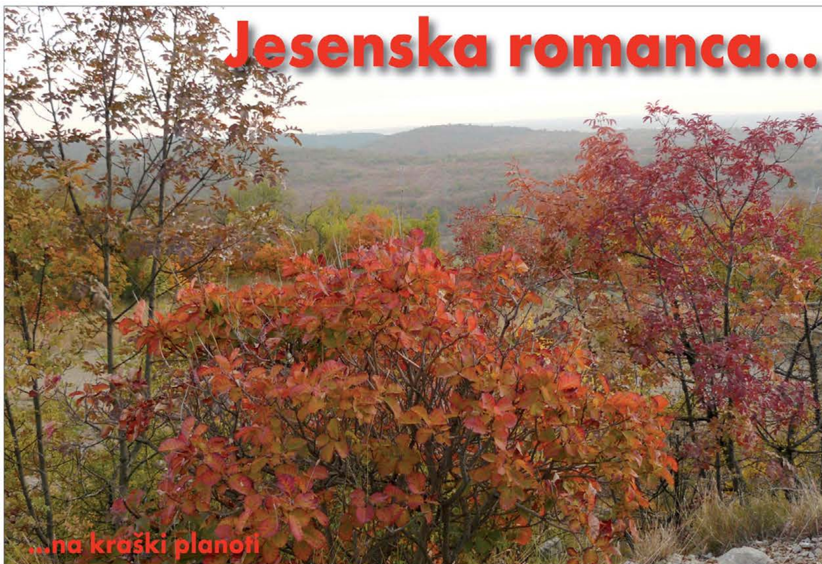
...na kraški planoti

In zato moramo poskrbeti, da bo tabla Trubarju in vsem našim prednikom stala na mestni hiši, kjer je oče slovenske knjižne besede pred toliko leti pridigal v treh jezikih Gorice, tudi v slovenskem jeziku seveda!