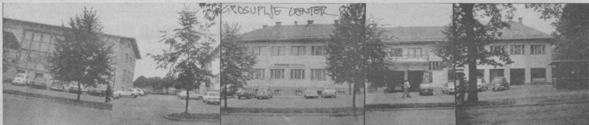
Kako lahko urbanist pozivi eno stran Kolodvorske ulice, ki jo obvladujeta obupno dolgočasni socrealistični stavbi bivšega združnega doma in občine? Spodaj je zarisana njegov predlog: arkadični vložek v pasazi z lokali.