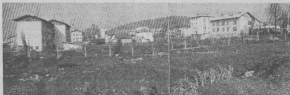
Med Kolodvorsko in Taborsko cesto, kjer so zdaj vrtovi, naj bi bil prihodnji center Grosuplje. V programu urejanja, ki ga predvideva Zavod za urbanistično načrtovanje, so trgovski, storitveni in gostinski lokali, kar je prikazano na spodnji skici. Ta pešačka ulica se izteka na Kolodvorsko ulico.