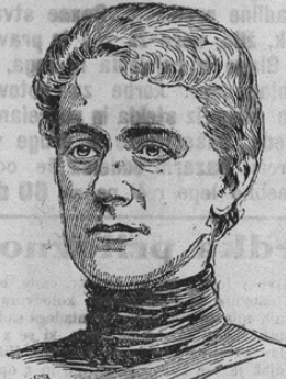
Frau Božena Vyk-Kunetický. d. erste weibliche Landtags-Abg. i. Oesterreich

Kakor smo že poročali, bila je v češkem volinlem okraju Jungbunzlau izvoljena pisateljica gospa Vyk-Kuneticky za deželnega poslanka. Izvoljenka je prvi ženski poslanec na Avstrijskem. Seveda izvoljenka brž-