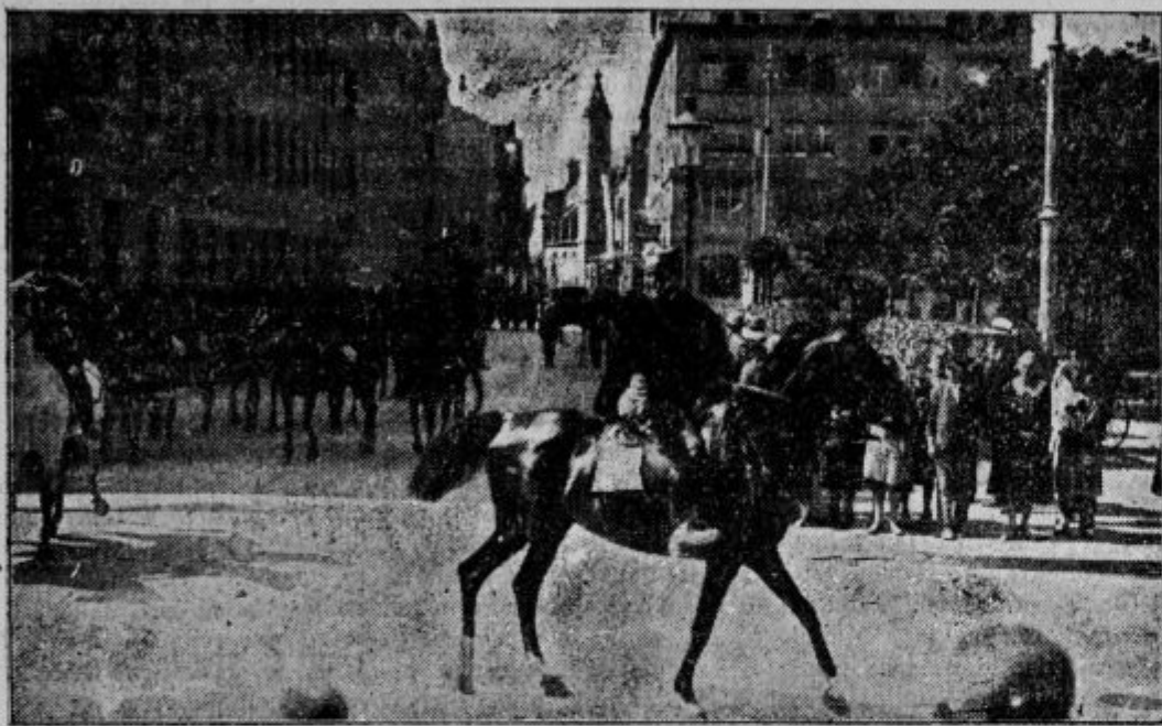
Orlovska konjenica otvori sprevod.

spremljali skoke s palico in skoke čez mizo in kozo. Najbolj napeta pozornost pa je zavlada ob pričakovanju izida štafetnega teka. Kdo bo prvi izročil zastavico, ki je šla iz roke v roko? Pri naslednji točki, vaje članic s kiji, je nastopilo 54 članic. Pri zadnji točki je pričakovalo na telovadišču v lepem kritju in polnem koraku 736 članov v dvaintridesetostopih. Zopet nepopisno navdušenje in vzklikanje. V dveh oddelkih, s skupino zastav na čelu, se ziblje rdečo-belo-modri val po pobočju. Prožni in odločni korak napravi vtis še večji. Vrste se zlijejo najprej v dva kvadrata, nato pa zopet razhajajo, vrste se dele in zopet združujejo, dokler se telovadci ne razstopijo na svoja mesta. S poveljniškega stolca zadoni pozdrav načelnika: »Bog živi, bratje!« in kakor en glas zadoni iz vseh stotin grl: »Bog živi!« Novo viharno navdušenje med občinstvom. Izvajanje prostih vaj je znova in znova izzvalo buren aplavz, zdaj se je zgrnilo polje v belo, zdaj v modro barvo in se zopet razgibalo v rdečo-belo-modro. Z lepim