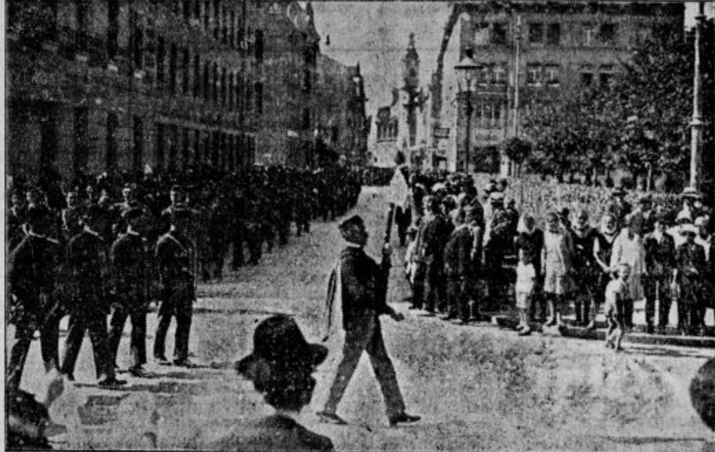
Orli v sprevodu.

slovenske javnosti. Orlovstvo je postalo danes sila, postalo je temelj katoliškega gibanja in up lepše bodočnosti slovenskega naroda. Javni nastopi te naše mladinske organizacije oddalec ne morejo pokazati vsega čistega intenzivnega izobraževalnega, vzgojnega in telesnovzgojnega dela, ki ga vrši s svojo strumno zgrajeno organizacijo po vseh najoddaljenejših vaseh naše slovenske domovine na fantovskih sestankih, na prosvetnih in telovadnih tekmovanjih, na številnih tečajih. Je pa vseeno vsak javni nastop od leta do leta lepši dokaz za disciplino v organizaciji, za enotnost vrst katoliške mladine, dokaz postopnega napredka v telesnovzgojni smeri. Orlovstvo se zaveda velike naloge, ki jo ima kot del katoliškega gibanja, zaveda se dolž-