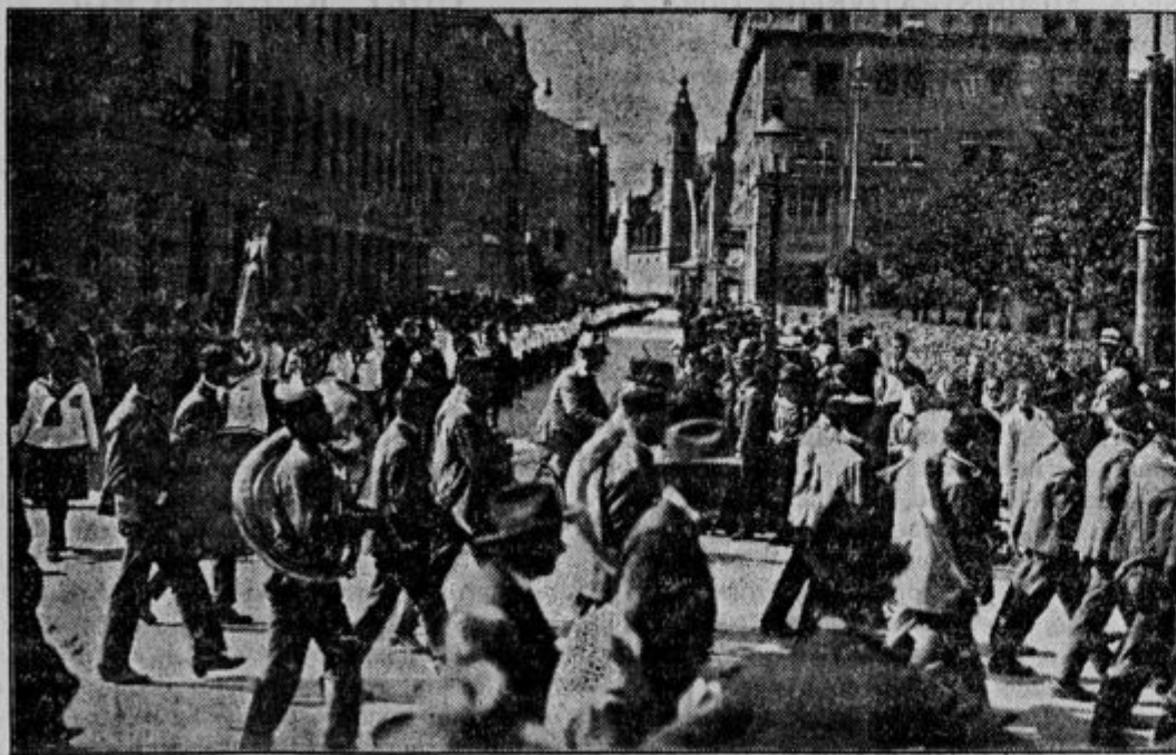
Orlice v sprevodu.

Popoldanskemu telovadnemu nastopu se prisostvovali na častni tribuni škof dr. Jeglič, načelnik SLS in predsednik Jugoslovanskega kluba minister dr. Korošec, veliki župan ljubljanske oblasti dr. Vodopivec, rektor ljubljanske univerze dr. Lukman, general Vukotić, predsednika oblastnih odborov v Mariboru in Ljubljani dr. Leskovar in dr. Natlačen, vladni komisar ljubljanske občine dr. Mencinger s sprogo, šef prosvetnega oddelka prof. Capuder, topniški polkovnik Jovanović, številni poslanci Jugoslovanskega kluba in oblastni odborniki in poslanci SLS.