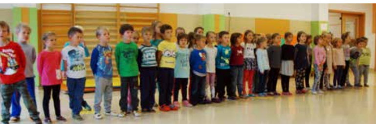
Otroci iz enote Žabica