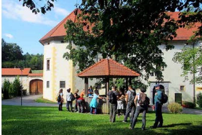
Med bolj zanimivimi je bila seveda točka pri gradu Jable. Uto za mladoporočence smo izkoristili kot prostor (ček) za hitro malico.

Mercatorja do Gregčevega mostu, nadaljevali po delu pšaške promenade do šolskega mostu in od tam krenili na Onger po bližnji med starim Trzinom in Mlakami (ki je še vedno neznana nekaterim šolarjem, pa čeprav je osvetljena in »ostopničena«). Nadaljevali smo mimo vodohrama pod Ongrom in po gozdni učni poti tik pod tamkajšnjim imenitnim arheološkim najdiščem in dalje po gozdu nad nekdanjim kamnolomom dolomitnega peska vse do jabelskega gradu. Pa spet naprej oziroma nazaj v gozd mimo smučišča v Dolgi dolini ter prek nizkega slemena na severozahodni konec Mlak, kjer so večje samostojno stoječe hiše. Pred gostinsko lokacijo smo si pogledali še novi vrtec in športni park, kjer smo kasneje »nogometirali« letom in vsem drugim dejavnikom primerno. Prednost (površinsko in prebivalstveno) majhnega kraja in občine je tudi ta, da je (lahko) župan bolj prilagodljiv in hitreje dosegljiv ter odziven kot v večjih občinah, zato je tudi nas na eni od točk pričakal ter nas po pozdravu in izmenjavi priložnostnih daril iz prve roke seznanil z najnovejšimi dogajanjmi v razvoju Trzina. ●