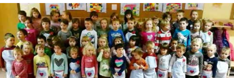
Otroci iz enote Palčica