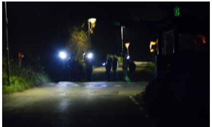
Nočni pohod po Trzinu in okolici