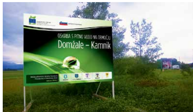
Velika tabla za oglaševanje (»jumbo« plakati) na slepem kraku Mengeške ceste v Trzinu

Do konca novembra 2016 so sodelujoče občine Kamnik, Mengeš in Moravče iz Kohezijskega sklada in državnega proračuna uspešno pridobile 1.482.686,55 € nepovratnih sredstev. Na Ministrstvu za okolje in prostor obravnavajo vloge Občine Domžale in Trzin za črpanje sredstev v skupni višini 1.022.025,39 €. Vrednost celotnega projekta znaša 11.384.020,51 €. Od tega bo Evropska unija iz Kohezijskega sklada v okviru Operativnega programa za izvajanje evropske kohezijske politike v obdobju 2014–2020 prispevala 6.940.942,77 €, Republika Slovenija iz državnega proračuna 1.224.872,25 € in vključene občine iz občinskih proračunov 3.218.205,49 €.