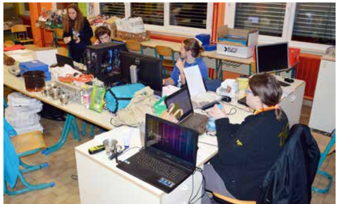
Organizatorji pri delu