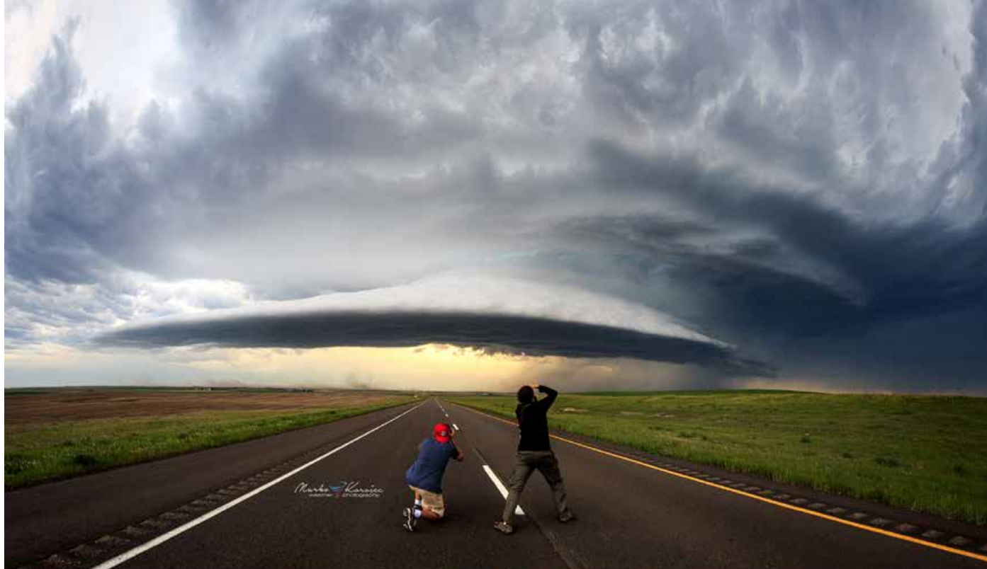
Lovci na nevihte v akciji