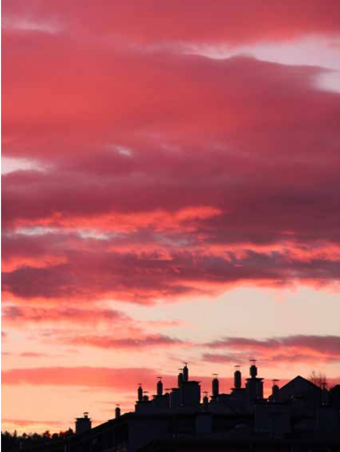
Poznojesenski sončni zahod je lahko v Trzinu zelo slikovit, odpraviti se je treba le na polje.