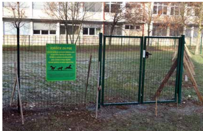
Novi pasji park v Trzinu za CIH