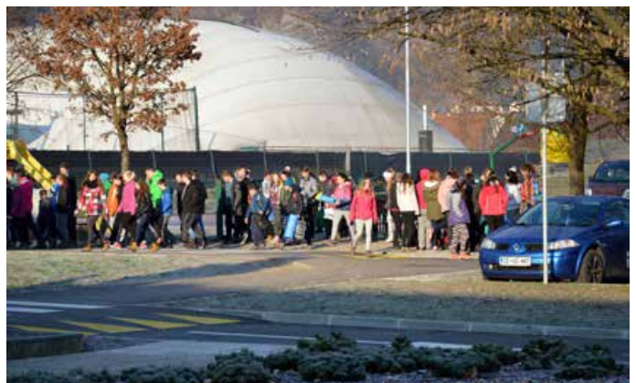
Zaspani so zapuščali jutranji zbor, kjer so razglasili rezultate.