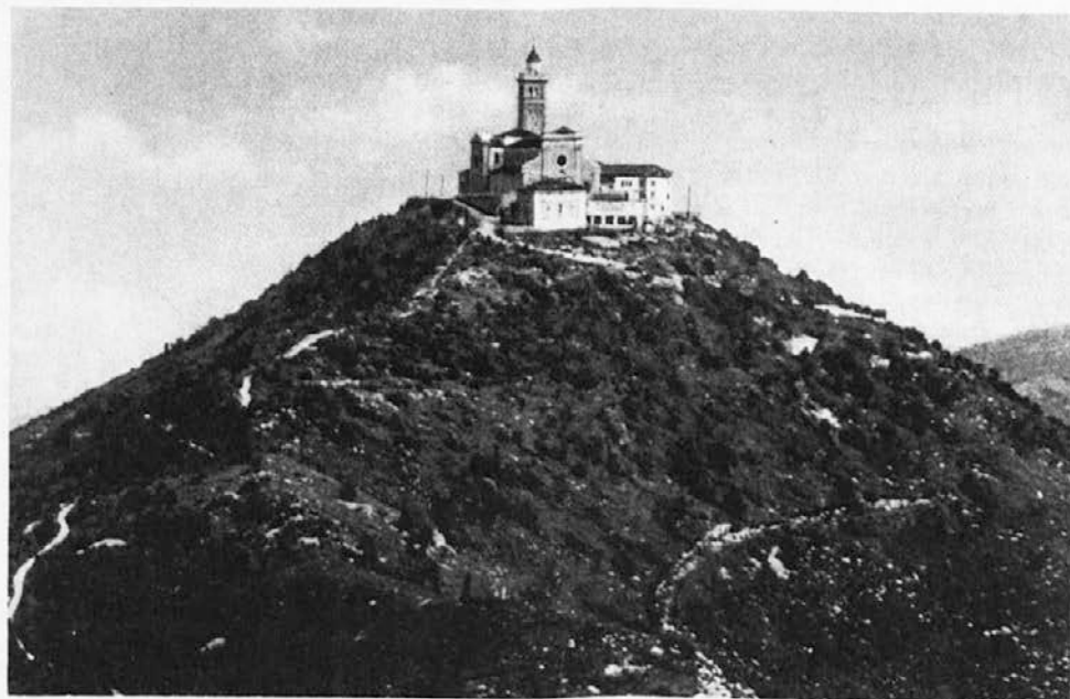
SVETOGORSKA KRALJICA prestoluje na vrhu Skalnice (682m), ki se dviga nad Gorico in Novo Gorico ter deli milosti številnim romarjem. Drugo leto bomo praznovali 450-letnico te znamenite naše božje poti, ki jo oskrbujejo frančiškani.

Toda poprej boš morala prezibati fantku še mnogo bratcev in sestric . . .