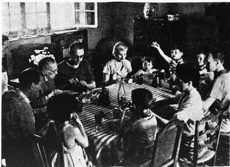
Zdrave krščanske družine so ponos Cerkve in poročstvo lepše bodočnosti.

Žene, le katero poklicno in moralno zadoščenje se more meriti s tem, ki ga lahko imate ve, da daste slovenskemu narodu in božjemu kraljestvu pet in še več (zakaj ne?) poštenih, izobraženih, vsestransko vzgojenih in srčno dobrih oseb? So primeri in zgledi, da to je mogoče! Potrebno je več korajže, ljubezni in zaupanja v božjo previdnost. Zaradi pogumnih smo preživeli v preteklosti, v njih je upanje na prihodnost, tako so lani povedali v posebni okrožnici tudi slovenski škofje.