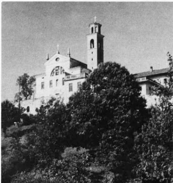
Marijina cerkev s frančiškanskim samostanom na Kostanjevici pri Novi Gorici