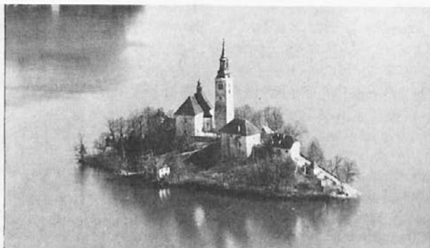
"Otok Bleški — kinč nebeški . . ."