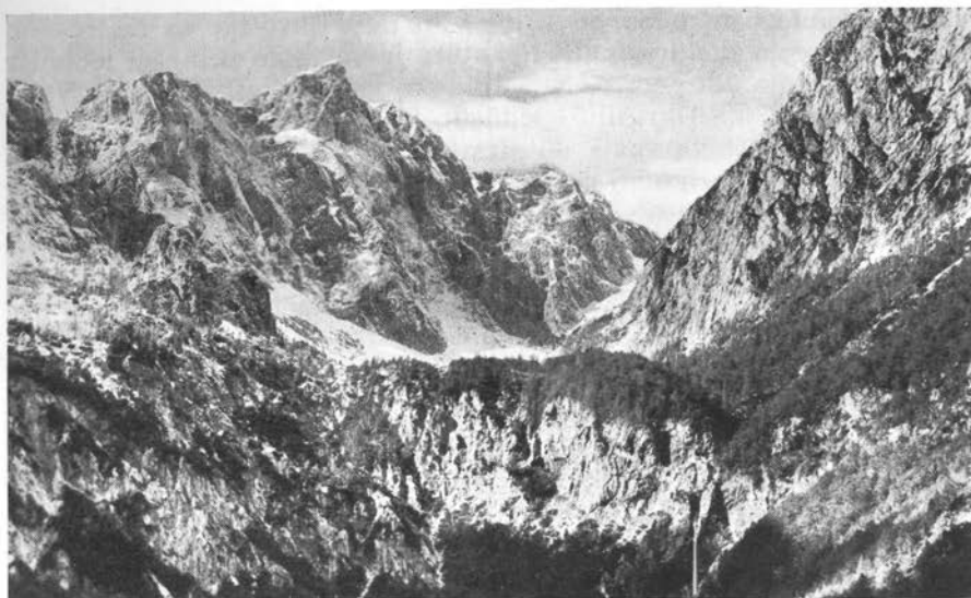
Narodni park Okrešelj