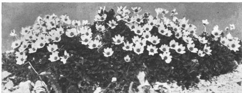
Velesa (Dryas octopetala)

Alpske trate se razprostirajo nad grmovnatim pasom do 2200 m višine, puščajo pa prestrme skalne stene gole. Nekaj centimetrov