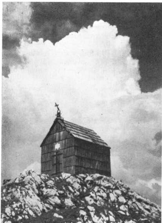
Kapelica pod Ojstrico — visoko v gorah ležeči spomenik slovanskima blagovestnikoma sv. Cirilu in Metodu