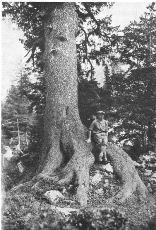
Orjaška smreka na Okrešlju

Od ptic pač največkrat vidimo planinske kavke, ki z glasnim kričanjem obletavajo gorske vrhove in po vsem Okrešlju razkazujejo svoje skupinske letalne spretnosti. Nekaj parov krokarjev gnezdi v nedostopnih skalah Planjave in Mrzle gore. S svojim globokim krakanjem opozarjajo nase; občudovanje zbuja njihovo mirno jadranje v zračnih višavah, kjer jim delajo družbo mišarji. V gozdnem pasu živi divji petelin, vendar bolj redko. Pač pa je pogost gnezdilec ruševce, ki domuje v grmovnatem pasu. Na planinsko kuro-belko