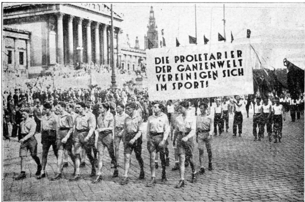
Mladinski dan na dunajski olimpijadi.