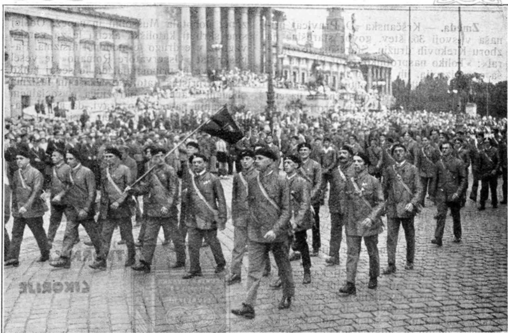
Belgijska delavska milica na dunajski olimpijadi.

Drugi glavni referat je pa bil o pravicah političnih jetnikov, ki ga je imel Eisler (Dunaj). Ta je zlasti zahteval, da naj se preiskava za take zločince prepusti