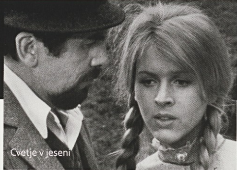
Cvetje v jeseni