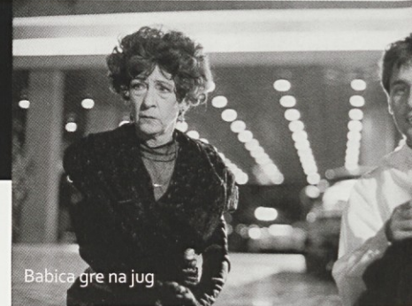
Babica gre na jug