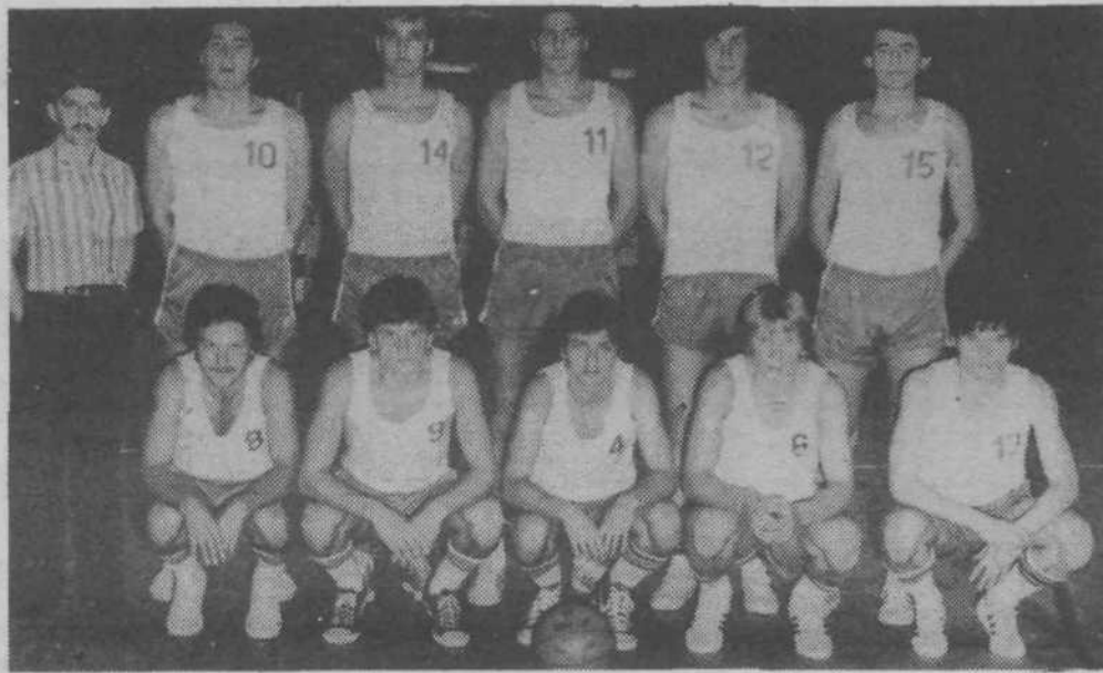
Ekipe KK Slovan — Ilirija v sezoni 1978-79 (manjka le igralec s št. 7)