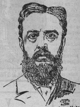
Rudolf Graf v. Khevenhüller-Netsch östr. Botschafter in Paris

Avstro-ogrski poslanik v Parizu, grof Khevenhüller-Netsch je hudo zbolel, tako, da se za njegovo življenja bojijo. Khevenhüller je sploš-