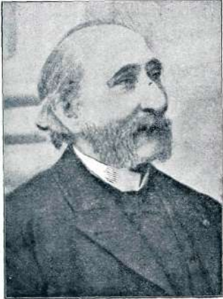
IVAN PL. ZAJC hrvaški skladatelj

beno visoko razvitih mestih. Ker ima občinstvo v rokah tiskano analizo cele skladbe, ki ga je uvedla v spoznavanje cele kompozicije, se nam ni treba spuščati v podrobnosti skladbe same. Pevski zbor sam je priznal veliko zaslugo svojemu vodji s tem, da mu je izročil ob burnem odobravanju mnogobrojnega občinstva srebrno liro z napisom: „Verdijev ‚Requiem‘ dne 7. in 8. maja 1907. Svojemu preljubljenemu pevovodju v znak hvaležnosti in visokega spoštovanja — pevski zbor ‚Glasbene Maticice“.