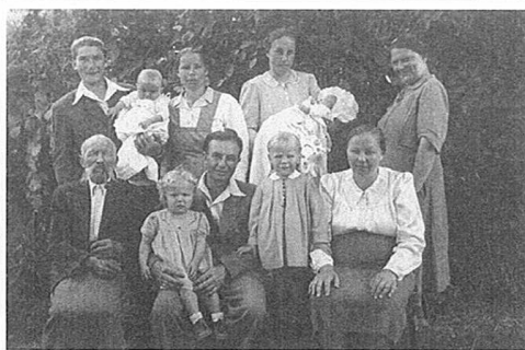
Spomin na sveti krst. Iz zapuščine Antona Kosija, okolica Ormoža, okrog leta 1940.