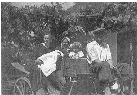
Otroka peljejo h krstu. Iz zapuščine Antona Kosija, okolica Ormoža, okrog leta 1940.

opravila mati ali babica. Botri so bili dolžni poskrbeti, da je imel otrok vse potrebno za krst. Tudi pozneje je boter moral skrbeti za otroka in z nasveti pomagati staršem pri otrokovi vzgoji. V povezavi s krstom je bilo krstno darilo botrov – križmank. Ta je bil prvotno v obliki kosa platna, pozneje pa bele srajčke. Z njim so pokrili otroka, ko so ga nesli h krstu. To krstno oblačilo pa naj bi imelo vlogo odganjati zle duhove. Boter je otroku daroval tudi krstno svečo, kot darilo pa se je pojavljali tudi denar. Otroka so za krst oblekli v najlepše, kar je družina premogla. H krstu sta ga nesli babica in botra. Krst je bil navadno zjutraj po maši. Obred krsta je bil zelo slovesen, saj je otrok takrat dobil ime in postal kristjan ter član cerkvene skupnosti. Belo platno /križmank/ je duhovnik pri krstu blagoslovil in položil na otrokovo glavo. Z njim je zaščitil maziljeno mesto ter izrekel besede: »Prejmi belo oblačilo in ga brez madeža prinesi pred sodni stol.« 11 Po krstu so šli v zakristijo, kjer so z denarjem obdarovali župnika. Doma so pred hišo botro in babico pričakali mati in ostali domači. Botra je vprašala mater: »Mati, kaj želiš, krščénika ali židova?« Mati ji je odgovorila, da krščénika, ga poklicala po imenu ter ga vzela v roke. 12