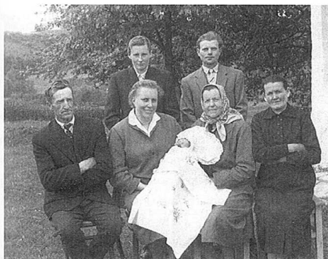
Spomin na sveti krst. Iz zapuščine Antona Kosija, okolica Ormoža, okrog leta 1940.

Po krstu so pripravili krstno slavlje /krstitke/. V slovesnem krstnem oblačilu je otrok ostal ves dan. Botra so med letom pogosto povabili na dom ter se skupaj pogovarjali o otrokovi bodočnosti. Tudi po krstu so hoteli otroka obvarovati na različne načine. Posebno pozornost so npr. posvečali rasti in striženju las. Prvo striženje las je bilo ponekod zelo slovesno, opravili pa so ga lahko šele po dopolnjem prvem letu otrokove starosti.