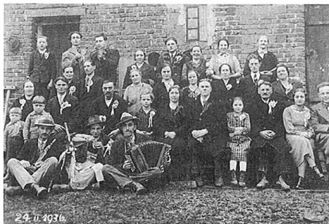
Poročna fotografija s svati, 1936. leta. Iz zapuščine Antona Kosija, okolica Ormoža.

Fotodokumentacija Pokrajinskega muzeja Ptuj – Ormož.