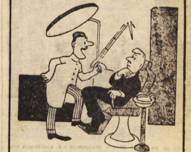
Se enkrat tako, pa vas zobje ne bodo nikoli več boleli.