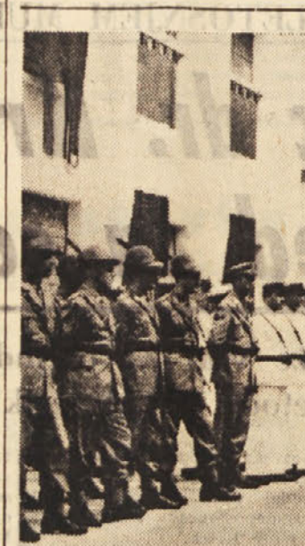
Financijski stražniki so v nedeljo imeli svoj praznik. Ob tej priložnosti je bila na dvorišču vojašnice «A. Postigionia slovesnost, med kateri je vojaški poveljnik področja gen. Vismarja podelil odlikovanja najbolj zaslužnim možem

Sicer pa, kje je in kaj dela komisija za učne načrte?