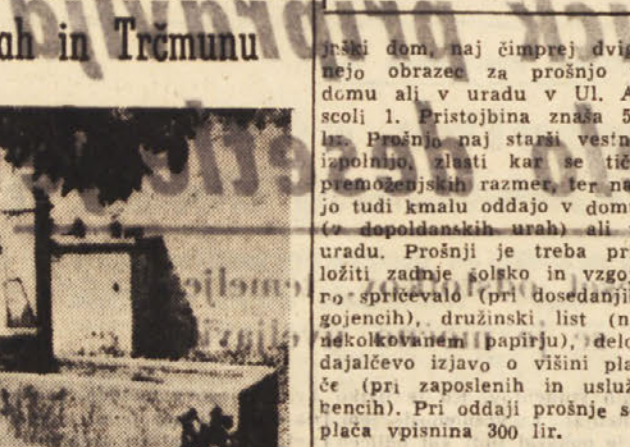
Vodovod v Mašerah in Trémunu

V Benečiji so v zadnjih letih z številnimi javnimi deli popravili pececi ter zgradili tudi nekaj novih, da so omogočili prebivalstvu tega hrbovitega predela svežo in srednje mizinskega dela. Zgradili so tudi nekaj vodovodov, ki so bili nujno potrebni. Vodovod v Trémunu ni med njimi. Zgraditi so ga v začetku tridesetih let prejšnjega stoletja, delo pa je bilo delno, da so cevi položili premo globoko in se v hudi vročini voda v njih segreje.