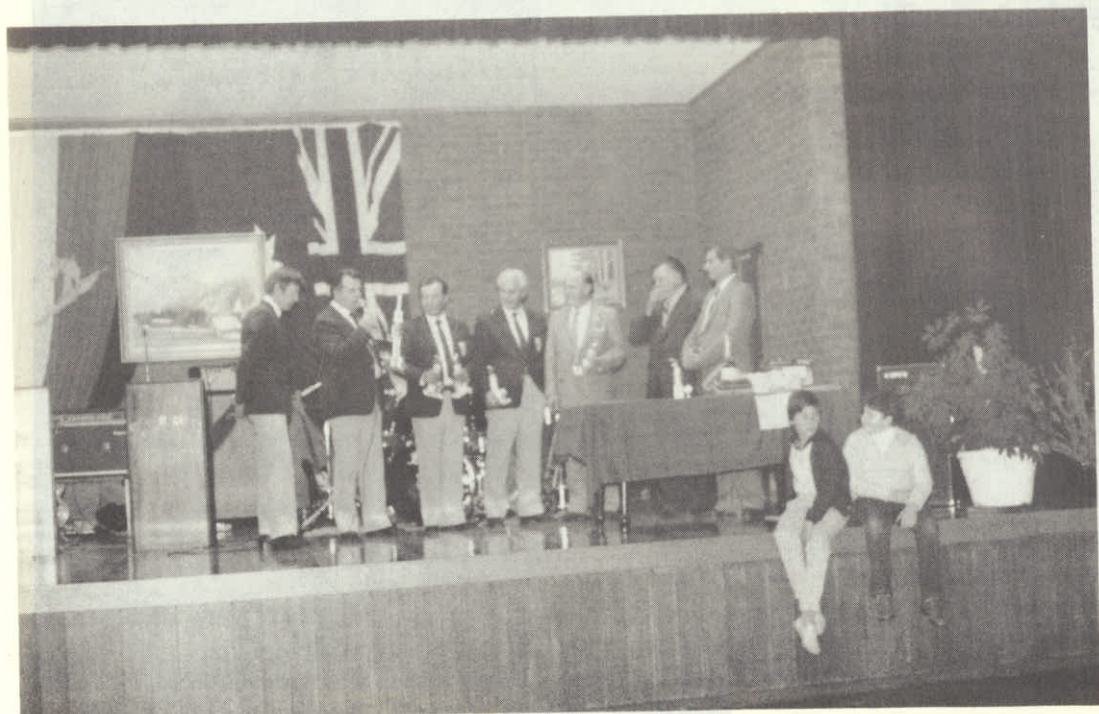
Prvo mesto v šterojki je letos zmagal S.D.M.