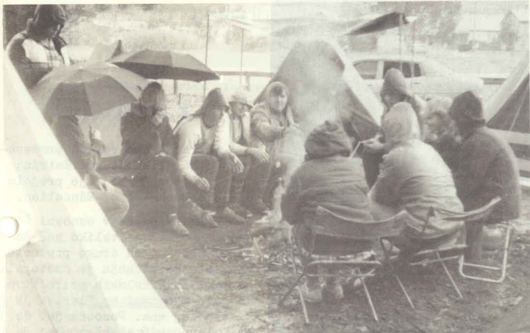
Youth Planica on their camping ground.