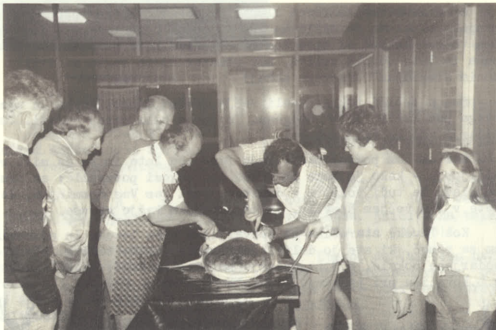
Starešina in podstarešina sta se kar lotila mesarit.