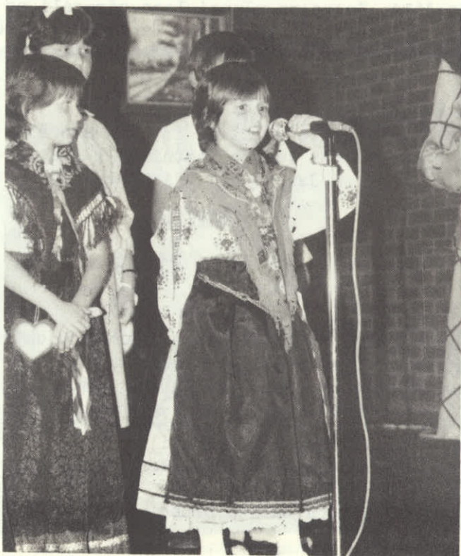
Šolski otroci Planice, ki so res pokazali kaj so se naučili.