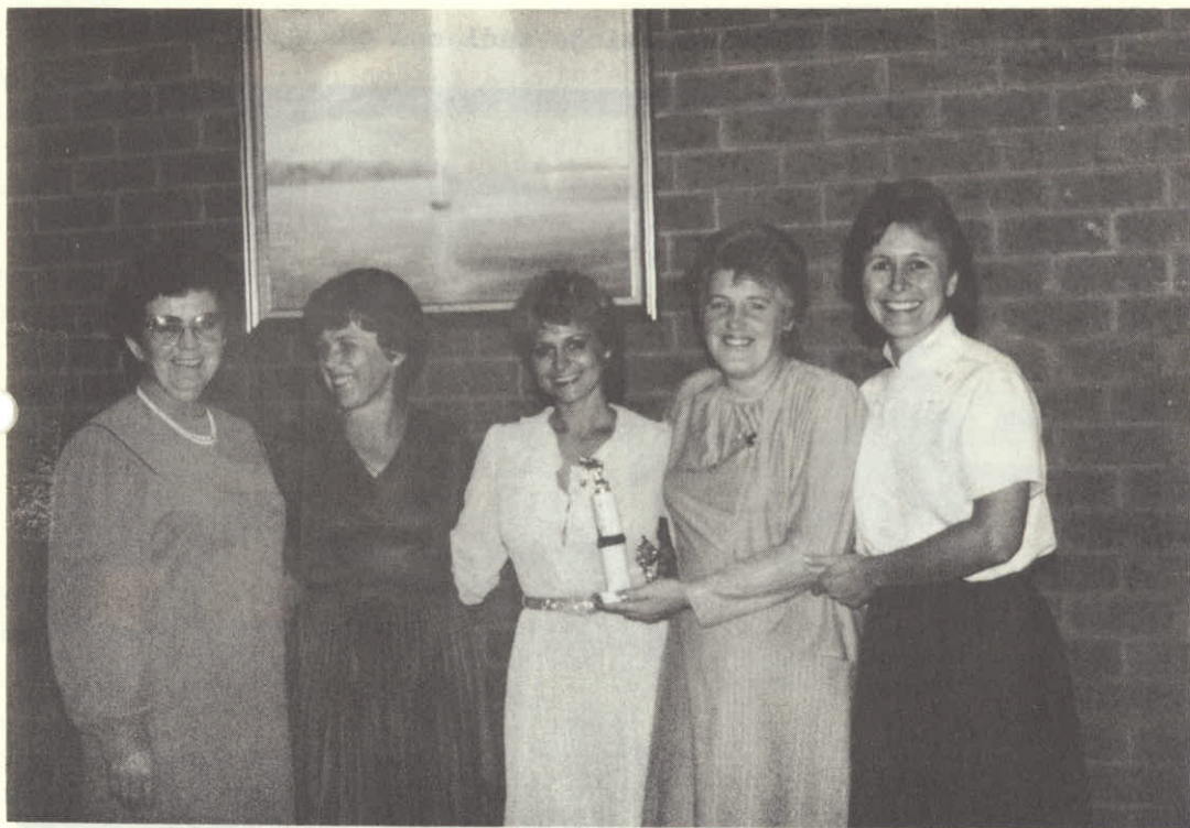
Balinarke ki so letos reprezentirale S. D. Planica.