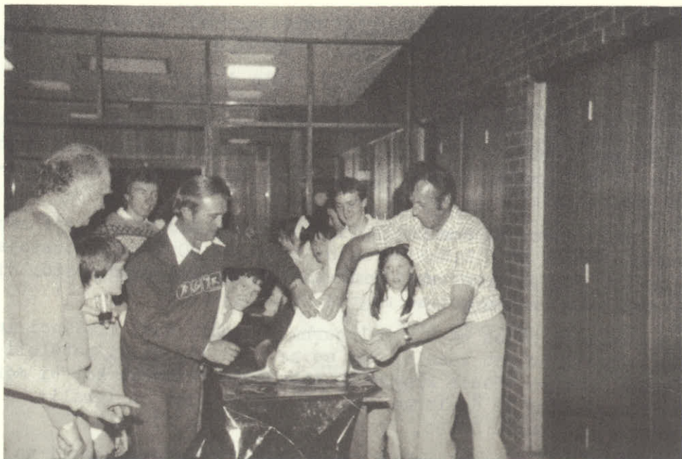
Vsi so prišli pogledati tega velikega morskega psa.