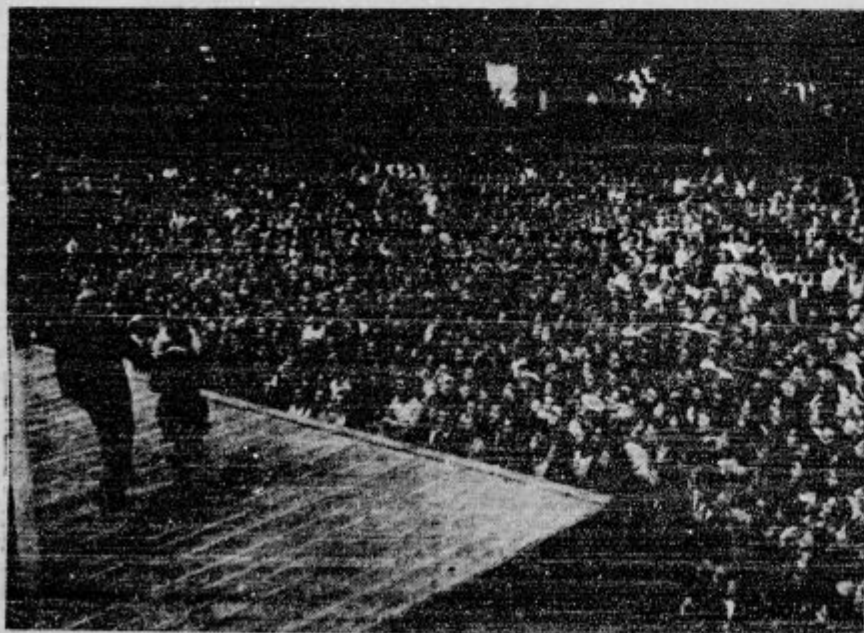
Pred veliko množico na ljubljanskem večeršnjem se vozi na kolesu prava pravcata opica. Brez spremljevalca pa seveda ne gre...