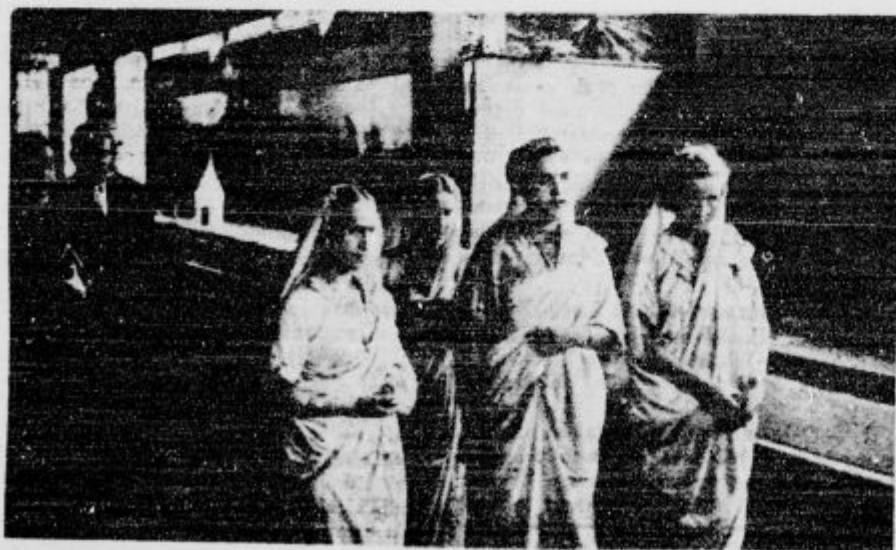
Ea največjih zanimivosti na letošnjem ljubljanskem velesejmju je misijonki paviljon. Tam dobiš tudi pravi indijski čaj.