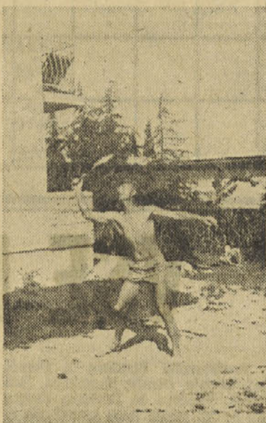
...badminton pred hišami v Dajli

zultati razgovorov s posameznimi igralci.