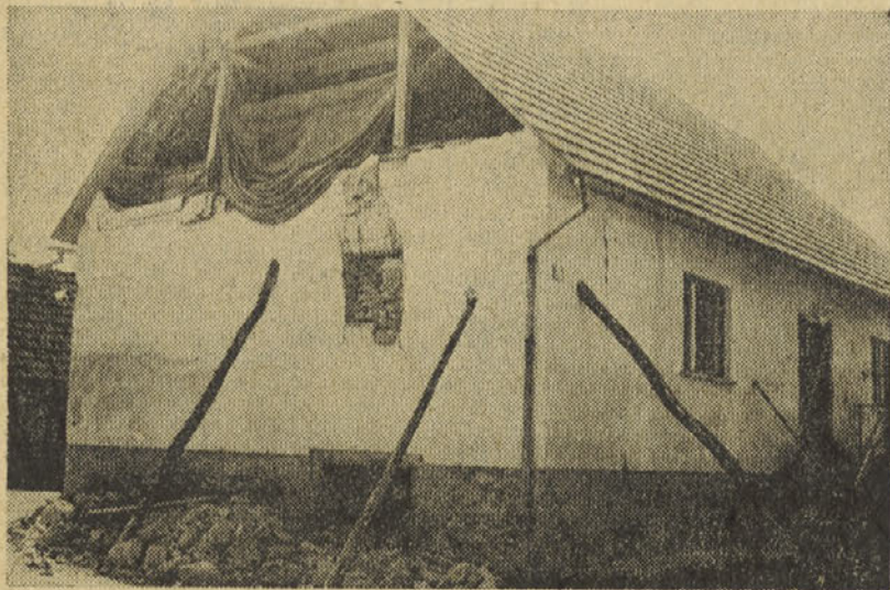
Nekoč lep dom — sedaj razdejanje

Zal ugotavljamo, da so pri nas tudi izjeme. Izjeme, ki ne spoštu-