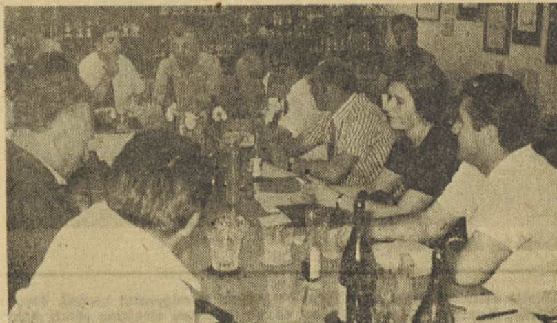
Člani komisije med razpravo