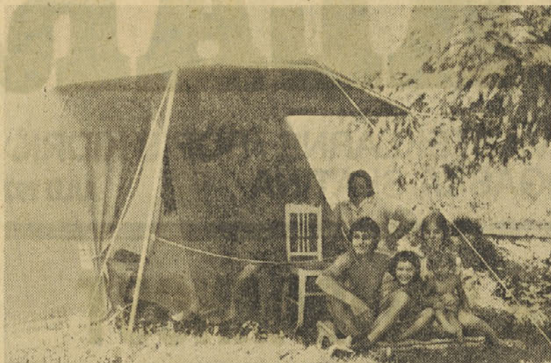
Začasni dom, ki zbuja skrb

jejo dogovorjenega. Ni jim bilo mar skupni dogovor velike večine kolektiva. Osemnajstim članom kolektiva v nobenem primeru ne more biti v čast, da se tej akciji niso odzvali. Zlasti nerazumljiv odnos so pokazali nekateri VK steklarji. Med njimi celo takšni, ki so s strani kolektiva za ureditev lastnih stanovanjskih problemov prejeli tudi po 8 milijonov starih dinarjev posojila.