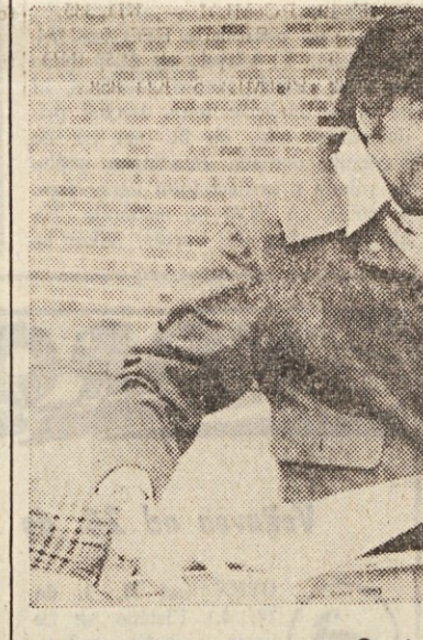
(Nadaljevanje na 6. strani)