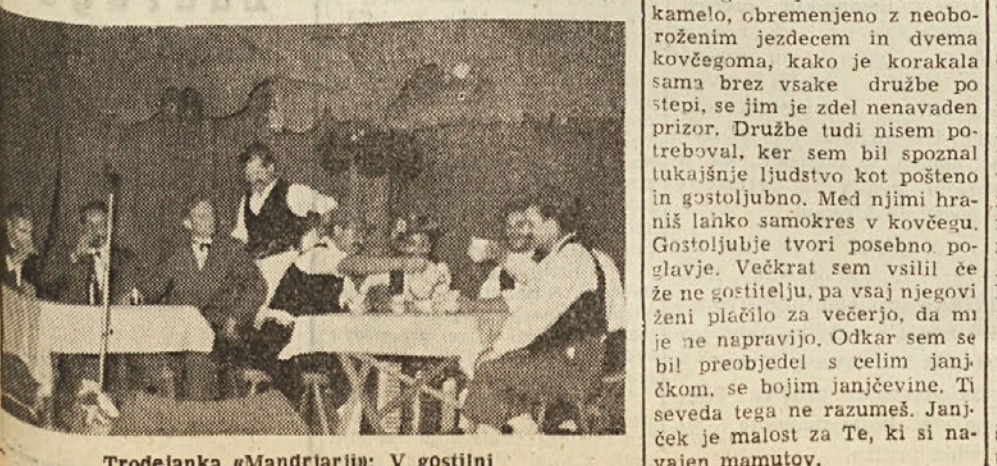
Trodejanica „Mandrjarji“ v gostilni