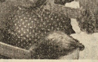
Vrta godba iz Doline je ime levi delež na proslavi