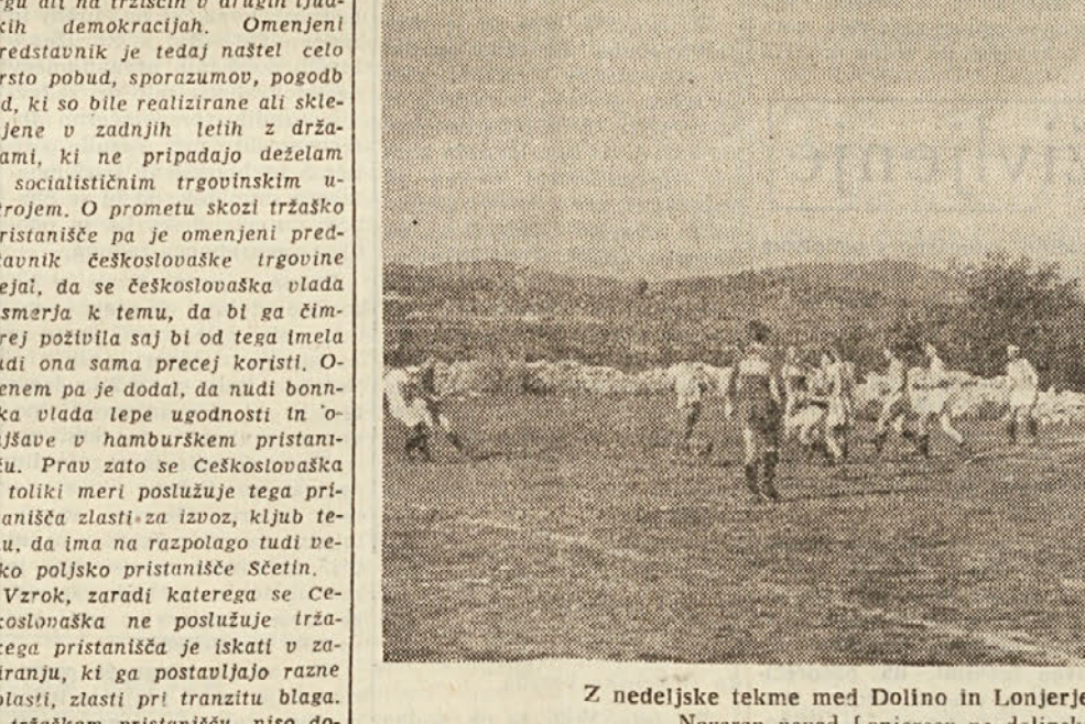
Z nedeljske tekme med Dolino in Lonjerjem v Trebčah: Nevaren napad Lonjercv na dolinska vrata