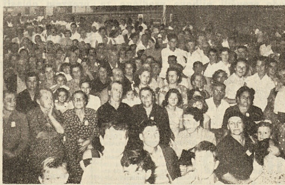
Ogromna množica pazljivo s'ledi izvajanju igre

Za mnogo let nismo imeli prilike videti tako veličastno in množično slovensko manifestacijo, kot je bilo nedeljsko zborovanje SHLP na Opčinah proti povratku fašizma in proti razkosanju Tržaškega ozemlja. Iz Trsta, iz vseh kraških in breških vasi, z Miljskih hribov so prišli naši ljudje z avtomobili, motorji, kolesi in peš, da bi prisostvovali veliki manifestaciji - pravečemu tabornu - ter da bi pridružili svoj odločni. «Nesli klicu tisočev in tisočev, ki se odločno upirajo vsakemu načrtu za razdelitev. Na velikanskem dvorišču je bilo kot v panju: glava pri glavi, drsi si se le s težavo utrl pot skozi množico. Do sedežev pred odrom pa nisi več mogel; pa bi bilo tudi odveč, saj so bili že podlugu uro pred začetkom sporeda zasedeni do poslednjega kotička. Kmalu so bile zasedene tudi vse mize, klopi in stolice, tako da ob petih nisti dobili več prostora, kamor bi se vzele. Tudi tisti stoji je vztrajala velikanska množica veji del programa, ki je trajal polna pet ur. E-