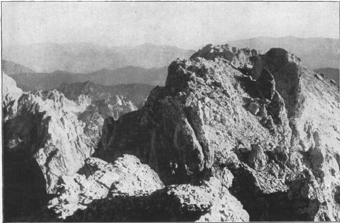
Grebeni Razóra (2601 m)