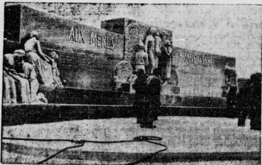
V Parizu so v znak hvalečnosti in spoštovanja do mater odkrili spomenik, ki naj poveljuje žrtve francoskih mater.