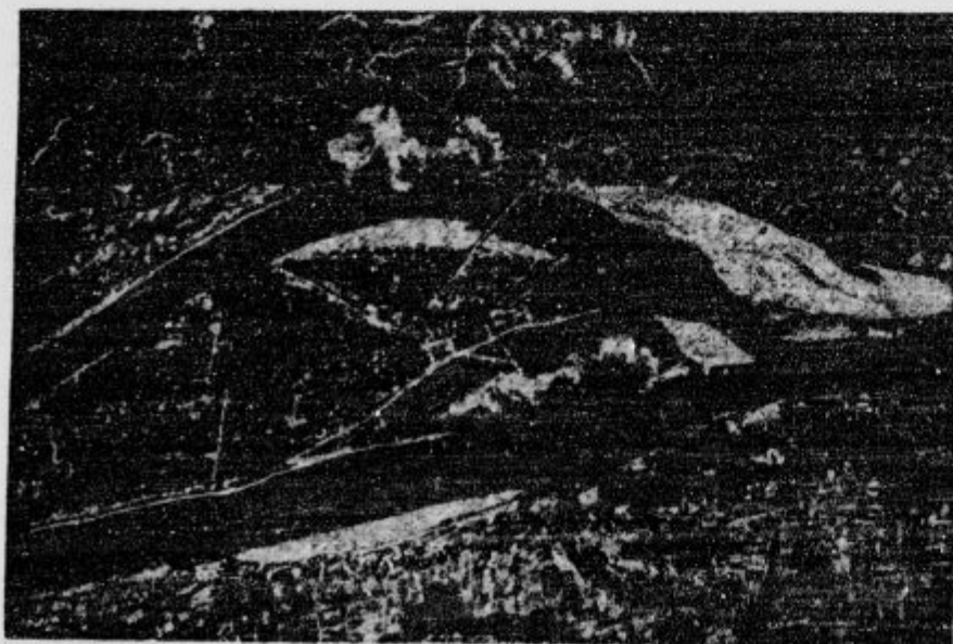
Važno kitajsko mesto Kanton padlo te dni Japoncem v roke