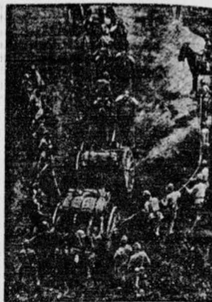
Japonski vojaki vlatijo topove čez visoke gore. Sestradne množice beže pred Japonci in iščejo pri misijonskih sestrah pomoči.

s Drobni. Siromašnih družinam v Ameriki bodo po znižani ceni prodali ostanek kmetijskih pridelkov, ki jih kmetje ne bodo mogli prodati po navadnih tržnih cenah. Razliko