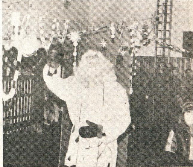
Na svidenje, otroci!