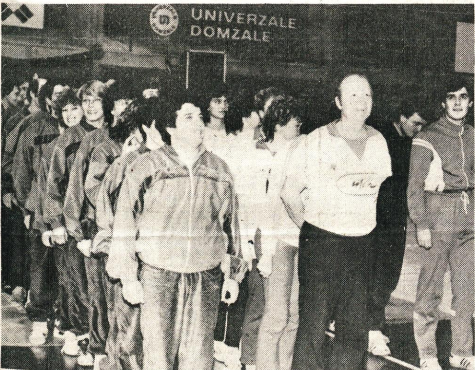
V IGRAH BREZ MEJA na zaključku sindikalnih športnih iger za leto 1985, ki jih je 21. decembra 1985 pripravila komisija za šport, rekreacijo in oddih pri občinskem sindikalnem svetu Kamnik, so nastopile le tri ekipe. Od leve proti desni: ekipa Svilanita, Utoka in Zarje. (Vera Mejač)