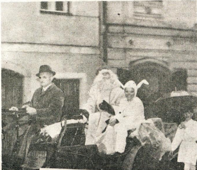
Sprevod dedka Mraza skozi Kamnik