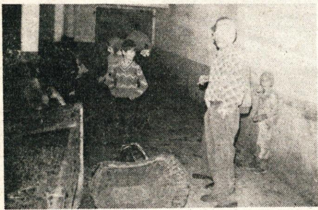
Tri generacije Jerasov v hlevu