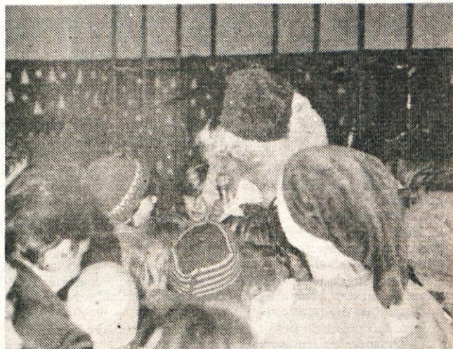
Dedek Mraz v pogovoru z otroki