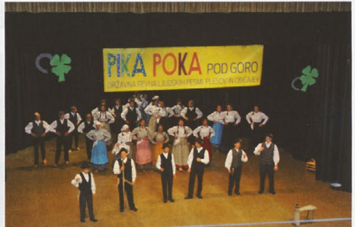
Nastop na državni reviji ljudskih pesmi, plesov in običajev

Vsako leto se še posebej veselimo prireditve Pika poka pod goro. Dan v Rogaški Slatini je za nas folklornike posebno doživetje in nagrada za pridno delo. Letošnja postavitev je govorila o košnji. Za veliko košnjo na prostranih travnikih je moral kmet najeti kosce in tudi dekleta so rada prihajala sušit seno,