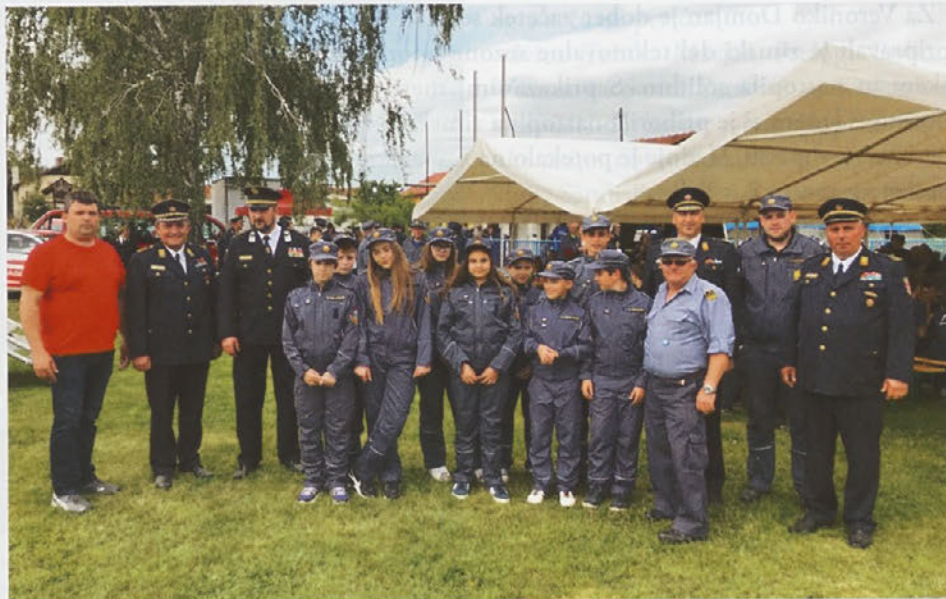
MLADI GASILCI PGD ZAVRČ Z VODSTVOM GZS NA SREČANJU MLADINE V KOPRIVNICI

OGZ Ptuj, kot naša krovna organizacija, nam je naložila tudi sodelovanje na spomladanskem operativnem pregledu, ki je bil 18. junija v Borovcih. Na tem pregledu smo bili dolžni pomagati tudi po organizacijski plati, saj smo GPO Zavrč kot enakopravni partner GPO Markovci poskrbeli za nemoten potek tekmovanja.