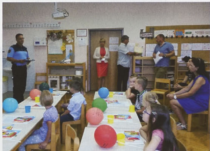
Aktivnosti na završki šoli, na prvi šolski dan, ko so bili predstavniki občine tudi v družbi letošnjih prvošolcev.

Prvošolčke smo na prvi šolski dan prvič varno spremili v šolo in domov. Tako kot že nekaj let smo organizirali varno spremstvo otrok na njihovem prvem srečanju v cestnem prometu. Ta posebna skrb pa ni bila namenjena le prvošolčkom, ampak