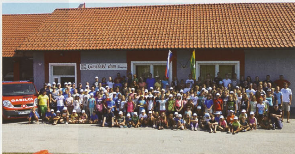
Letošnjega tabora gasilske mladine OGZ Ptuj so se udeležili tudi mladi gasilci PGD Zavrč.

Mladi gasilci iz gasilskih poveljstev občin Markovci, Hajdina, Cirkulane,