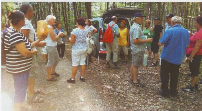
Romanje k sv. Ani, na križev pot