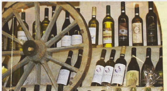
Nagrajena vina haloških vinarjev, med njimi tudi vino Turizma Pungračič iz Drenovca