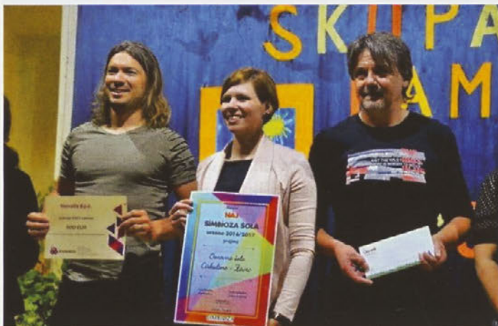
Ponosni na naziv naj simbioza šola 2017