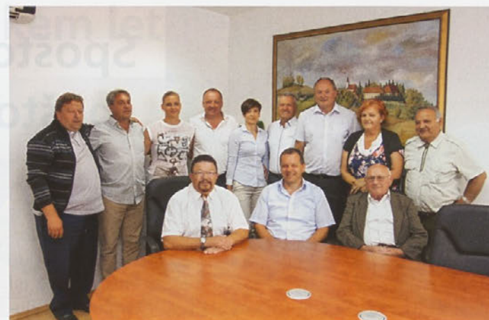
Na slavnostni seji so se svetnikom pridružili letošnji nagrajenci.

Občanke in občani občine Zavrč so avgusta znova praznovali. Dolg spisek prireditev in zanimivih dogodkov so posvetili letošnjemu 21. občinskemu prazniku in 23-letnici samostojne občine, osrednja slovesnost pa je bila v soboto, 12. avgusta, v završki kulturni dvorani. Uvod v slovesnost je bila slavnostna seja občinskega sveta, na katero so bili povabljeni tudi letošnji občinski nagrajenci.