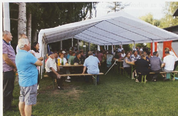
V Zavrču so ob občinskem prazniku predstavili novi šotor Civilne zaščite.