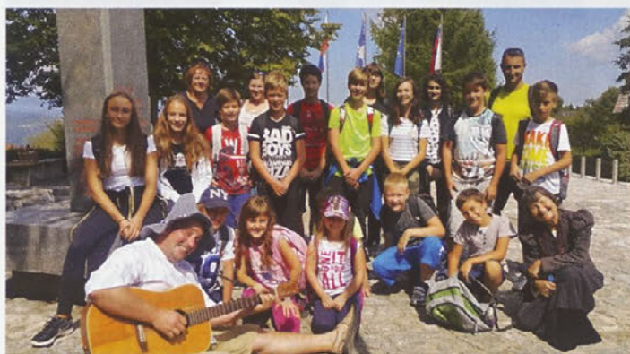
Na nagradni ekskurziji z naj učenci je bilo prijetno.

Tako smo se 29. avgusta zjutraj odpravili proti Vačam pri Litiji. Pri starem vodnjaku nas je pričakala čisto prava vaška klepetulja in nam povedala nekaj zanimivosti o življenju na Vačah nekoč in danes. V bližnji cerkvi sv. Andreja smo si ogledali božji grob, narejen iz čudovitega vitraža. Na sprehodu skozi vas nas je presenetil palček ter nam na zabaven in pravljичen način povedal veliko zanimivega o sušilnici lanu. Občudovali smo tudi povečano poustvaritev znane situle z Vač in na fosilni morski obali prave fosilne ostanke s tega območja. Pot smo nadaljevali v Geoss. V samem srcu Slovenije smo ob Zdravljici začutili pravi pomen narodnosti.