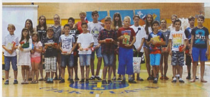
Naj učenci na zaključni prireditvi

V petkovem dopoldnevu, 23. junija, smo zgodbo šolskega leta 2016/2017 končali tudi na OŠ Cirkulane - Zavrč. Po prejemu spričeval, zasluženega plačila učencev, smo se podali proti Cirkulanam, kjer smo oblikovali zaključni program, podelili knjižne nagrade in sladka presenečenja. Poseben slavnostni trenutek je nastopil z vpisom v zlato knjigo, ki je prepredena z imeni in priimki najuspešnejših učencev na šoli.