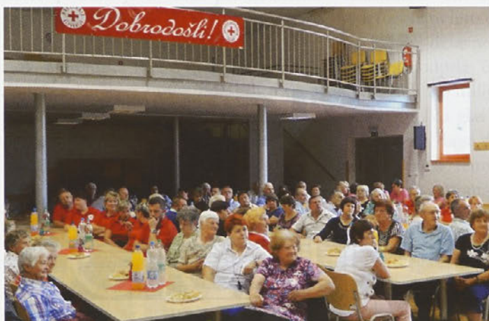
Utrinka z letošnjega srečanja krvodajalcev v občini Zavrč