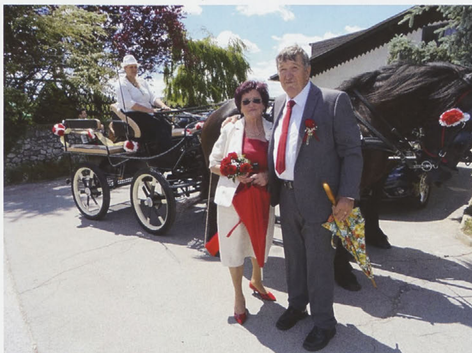
Zlatoporočenca sta se peljala tudi s poročno kočijo.