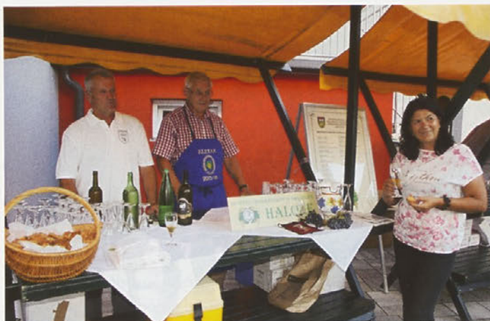
Na stojnici se je s ponudbo odličnih vin predstavilo tudi Društvo vinogradnikov in sadjarjev Haloze.