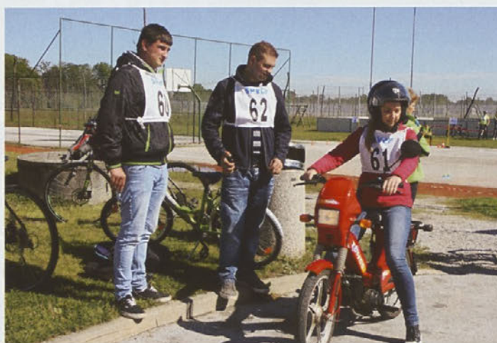
Varna šolska pot in kolesarji

Voznik in potnik na kolesu morata imeti do dopolnjenega 18. leta starosti med vožnjo ustrezno pripeto zaščitno kolesarsko čelado. V vednost tudi podatek o odgovornosti staršev, saj se z globo 120 evrov kaznuje za prekršek starš, skrbnik, rejnik