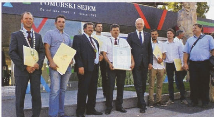
Uspešnim vinarjem iz Haloz je na AGRI čestital tudi minister za kmetijstvo, gozdarstvo in prehrano mag. Dejan Židan.