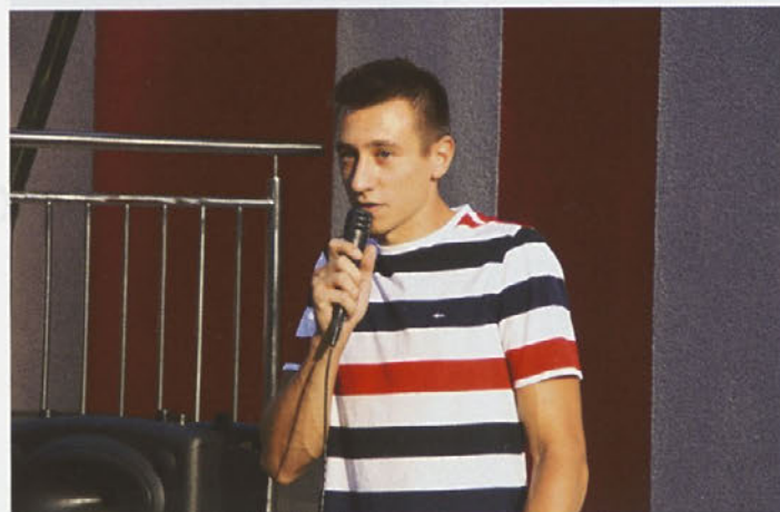
Posebej se je ob prazniku predstavilo PGD Zavrč.