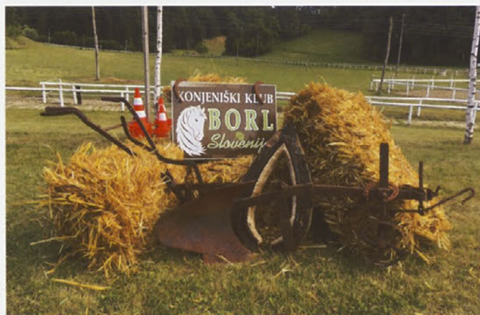
Utrinki z letošnjih konjeniških iger na posestvu družine Vuk

Ker so Konjeniške igre ena od prireditev v okviru občinskega praznika, smo k sodelovanju povabili tudi druga društva iz naše občine. Da je naša prireditev tako uspela, so zaslužni tudi Društvo gospodinj Zavrč, Društvo upokojencev Zavrč, Turistično