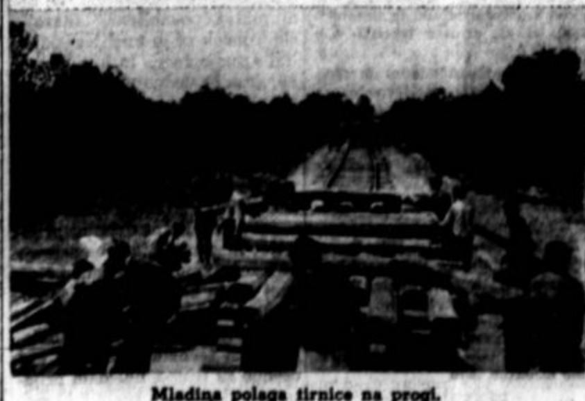
Mladina polaga tirnice na progi.

When a company brings its office to you... THAT'S SERVICE!