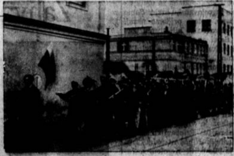
Slovanke mladinske brigade odhajajo na progo Šamac-Sarajevo. Od vsespovsod se zbirajo, iz industrijskih središč kakor tudi iz kmetijskih naselij. Slovanke ljudska mladina je bila zelo aktivna pri obnovi tudi lanskega leta. Na "mladinski progi Brčko-Banovići" je sodelovalo 5.000 mladincev in mladink poleg 1400 mladincev iz Julijske Krajine in Trsta. Pri ostalih akcijah je sodelovalo nad štiri tisoč mladincev, pri regulaciji Pesnice nad 1.500. Uspeh: 10.000 hektarjev plodne zemlje. Letos se abirajo, da bodo še v večjem številu sodelovali na progi Šamac-Sarajevo. — Slika prikazuje mladinsko delovno brigado "Triglav" iz Ljubljane.

sen razgled na mesto in okolico in se vračajo zvečer odpočiti in okrepani zopet na zemljo. Navala na ta izvirni zračni sanatorij je silno velik in skoraj gotovo si bo moral dr. Crewe omisliti zračno filialko.