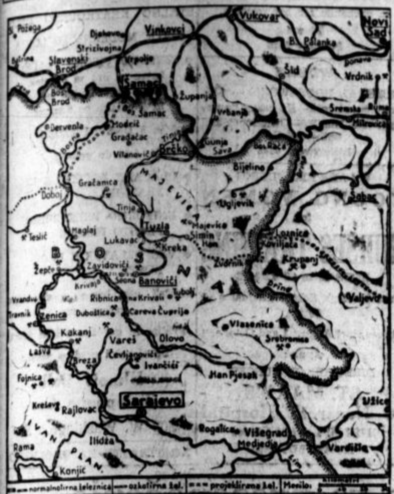
Slika prikazuje zemljevid projektirane proge Šamac-Sarajevo. Srednja Bosna ima vse pogoje za razvoj teške industrije. Tu je na raspolago premog in železna ruda in druge važne kovinske rude. Ne samo po svoji dolžini temveč tudi po obsegu gradbenih del, zahteva gradnja proge mnogo večje napore, kakor jih je zahtevala gradnja "mladinske proge 1946" Brčko-Banovići. Načrti industrializacije zahteva prometno zvezo rudarsko-industrijskega bazena Zenica-Vareš proti severu. Dosedanja oskotirna proga Brod-Sarajevo je danes ne zmora prometa, kaj šele, če se razvije teška industrija v predvidenem obsegu.

Po velikih uspehih, ki so jih dosegli jugoslovanski mladinci z izgradnjo železniške proge Brčko-Banovići v letu 1946 in ki so zbudili občudovanje po vsem svetu, je bila za leto 1947 postavljena jugoslovanski mladinci nova, še večja naloga, izgraditev nove "mladinske proge" Šamac-Sarajevo. Graditev te proge je bila najvišja in najodgovornejša naloga, ki je bila zaupana mladini v tem letu.