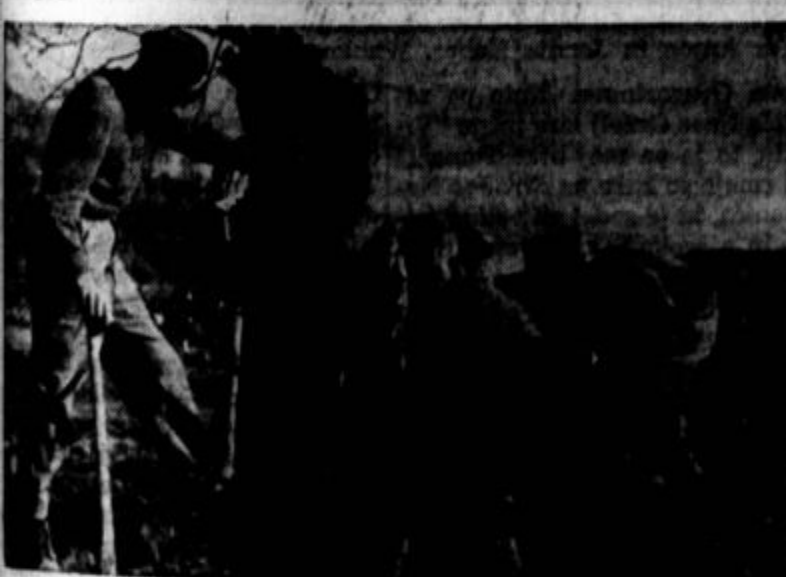
Delo na progi Šamac-Sarajevo. Mladinci čistijo teren.