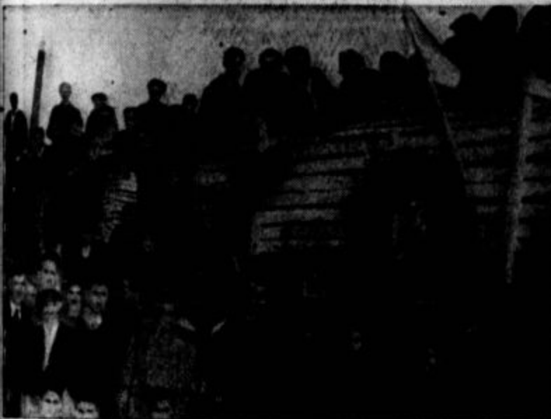
Za mladince na progi Šamac-Sarajevo so postavljene lesene barake.