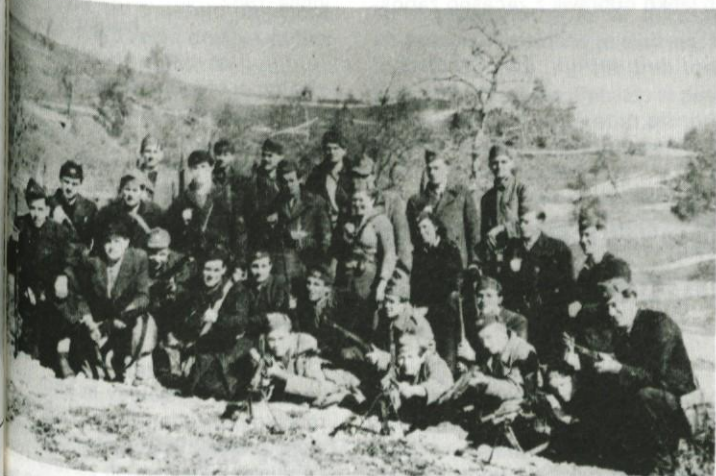
Borci 2. bataljona 1. Dolomitskega odreda (februarja 1943 na Babni gori)

Med partizanskimi odredi, ki letos slavijo 40 let svoje ustanovitve, je tudi Dolomitski odred NOV in POS. Ustanovljen je bil med 1. in 10. julijem 1942 na Kluču in Vranjih pečinah v Polhograjskih Dolomitih. Po njem je tudi dobil svoje ime.