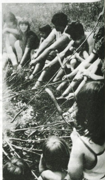
Pomagaj si sam!