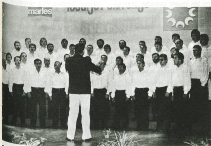
Okteti so spet zapeli v zboru (Foto F. Godina)

JUBILEJNO SREČANJE »LESARJEV«. – Sredi maja so se v Mariboru srečali letos že deseti zaporedni okteti lesne industrije Slovenije. Gostitelj jubilejnega lesarskega srečanja je bil vokalni okteti »Marles«, ki je sam letos slavil 15-letnico uspešnega prepevanja. Poleg gostitelja so tistega večera v Unionski dvorani zapeli še okteti: »TRO« s Prevalj, »Javor« s Pivke, »Jelovica« iz Škofje Loke, »Lesna« iz Slovenjgradca in »KLI« Logatec. Okteti združeni v zboru »Lesarji« pa so pod vodstvom Tomaža Tozona nastopili s programom, s katerim so na aprilskem mariborskem tekmovanju segli po srebrni plaketi. Živo pevsko prijateljstvo se združuje v vse bolj kakovostnem petju; oboje predstavlja dragoceno vrednoto.