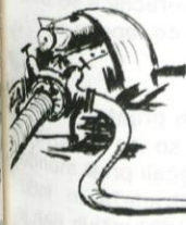
Prostovoljno delo za vzor