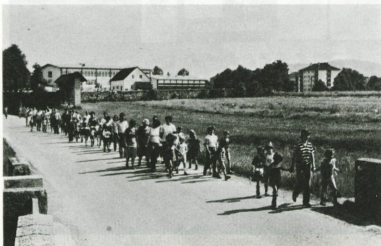
Skupaj na pot

Žal, male šole pa je konec. Z večanja se velika, osnovna, celodnevna.