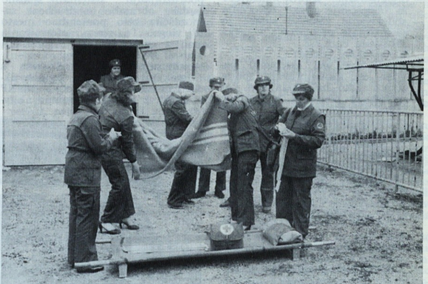
Enota prve medicinske pomoči