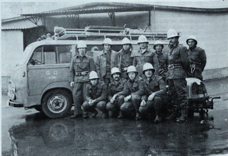
Gasilska enota CZ krajevne skupnosti Vir