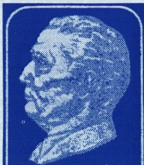
III. KONGRES SAMOUPRAVLJALCEV JUGOSLAVIJE 1981

— Potrebno je večje angažiranje subjektivnih sil in celotnega