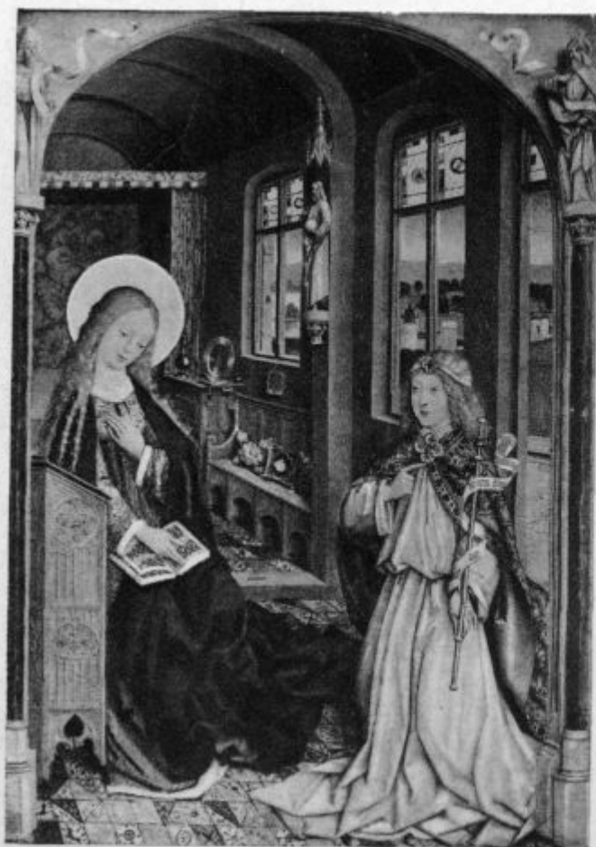
Glej, dekla sem Gospodova.

previdnosti in po razmerah v župniji nam je dal navodila, kdaj naj prihajamo in kako naj prihajamo, da bo red. Prvo nedeljo v mesecu moškimi! Ženska naj ne hodi zlasti ob nedeljah nikdar na moško stran k spovedi!