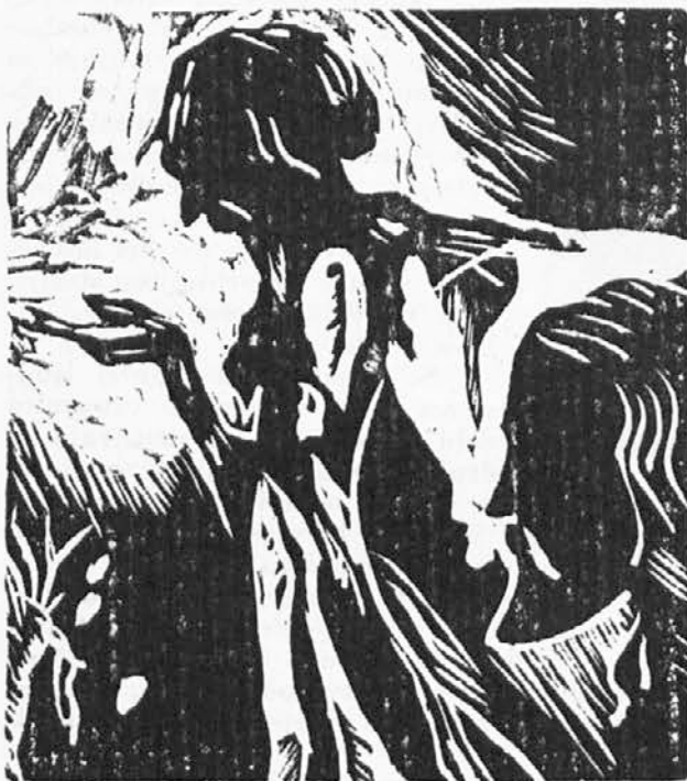
Kristus in Judež

Dragi! Ko v šoli čisto za Teboj sedim, me večkrat prime, da bi Ti sredi najbolj tihe ure naravnost v uho izkričal, kar mi kot mora na srcu leži. A bojim se, da bi me slišali vsi drugi, samo Ti bi ostal gluha za moje besede. Zato Ti rajši pišem. Morda Ti bo šla pisana beseda bolj do srca, morda tudi ne bo več tako z mojo osebno trpkostjo prežeta in boš iz nje laže začutil bridko ljubezen, iz katere je porojena.