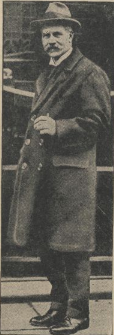
J. Ramsay MacDonald.

lu do l. 1917, ko je pričela neodvisna delavska stranka z energično propagando proti nadaljevanju vojne. Vso delavsko stranko je koncem vojne in po vojni preževal socialistični duh. Danes je ona vodilna članica socialistične in delavske internacionale, ki je bila ustanovljena prošlo leto v Hamburgu. Sedež Internacionale je v Londonu.