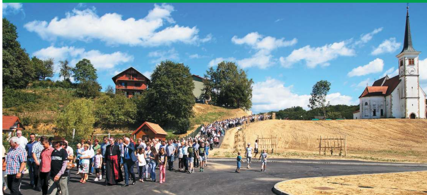
Otvoritev nove obvozne ceste in avtobusne postaje