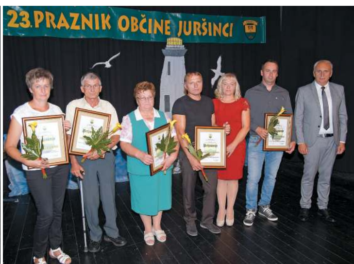
Prejemniki plaket in priznanj ob 23. prazniku Občine Juršinci