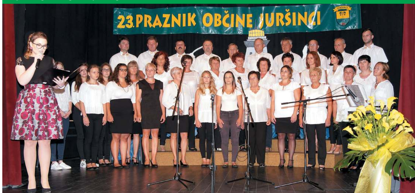
Mešani pevski zbor župnije in kulturnega društva Juršinci