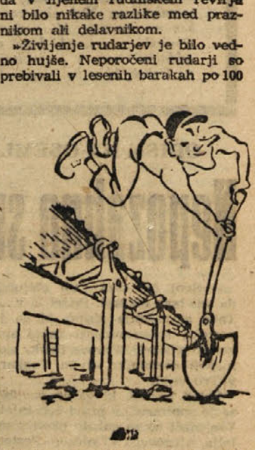
Glejte! Športnik ostane športnik

Nekdanji časnik »Slovenski narod« je 26. julija... pisal o položaju zasavskih rudarjev takole: »Razmere delavcev niso bile več človeške... Kopači so služili po odmerjale kar po dva goldinarja, in pa to, da so samci sicer morali vplačevati v rudniško skladnico, a niso imeli od tega nikake koristi, nobene pravice... Zahtevali delavcev niso pretirane. Oni zahtevali, da se jim mezde za 20 odstotkov zvišajo (po drugih »Narodovih« poročilih za 50 ali 60 odstotkov), da se jim daje olje za luč, da jim ob nedeljah ne bo treba delati kakor doslej, da so tudi samci deležni dobrot in koristi rudniške skladnice in da smejo živeti in blago kupovati tudi drugod, ne pa izključno pri »konzumnem društvu«... Dne 1. avgusta je dopisnik dodal še: »Zadnje moje poročilo mi je popolniti v toliko, da je zagorska in trboveljska raja poleg tega... zavezana tudi še plačevati stanovanje, ki je večinoma podobno beznicam, ter od neznatne svoje dneve nabavljati si tudi dinamit ter drugo strelivo, ki ga uporablja pri delu.«