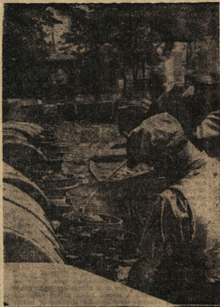
Fri popravilu jamskih vozičkov

Na Rudniku Trbovlje-Hrastnik so preteklo leto in letos izvedli vrsto pomembnih ukrepov za decentralizacijo dela in približanje samoupravljanja v obrate podjetja oziroma v ekonomske enote. Vzpostavljajo s tem na rudniku ob občini zborni sindikalni organizacije ustanovili tudi samostojne sindikalne podružnice in podobno.