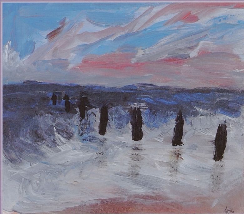
»Po NEVIHTI« (NEŽA KRAVOS, AKRILIK NA PAPIRJU, 2007).